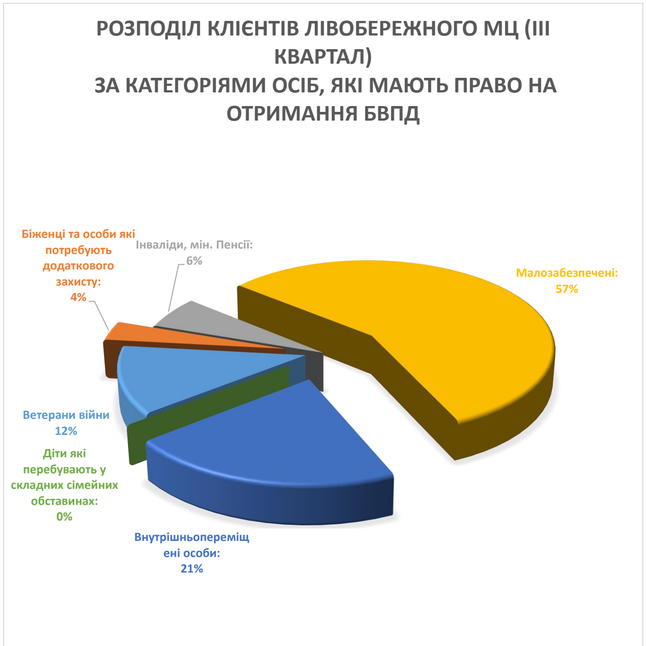
Діаграма 5. Щодо розподілу клієнтів, яким надано БВПД, за категорією осіб

Крім цього, місцевим центром в тому числі бюро правової допомоги за III квартал було: