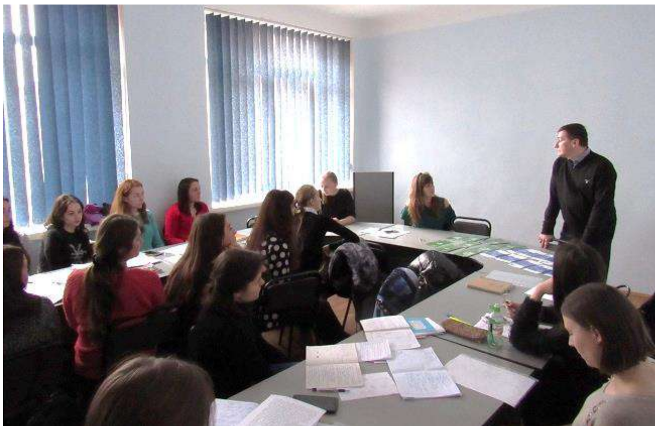
Рівненський державний гуманітарний університет