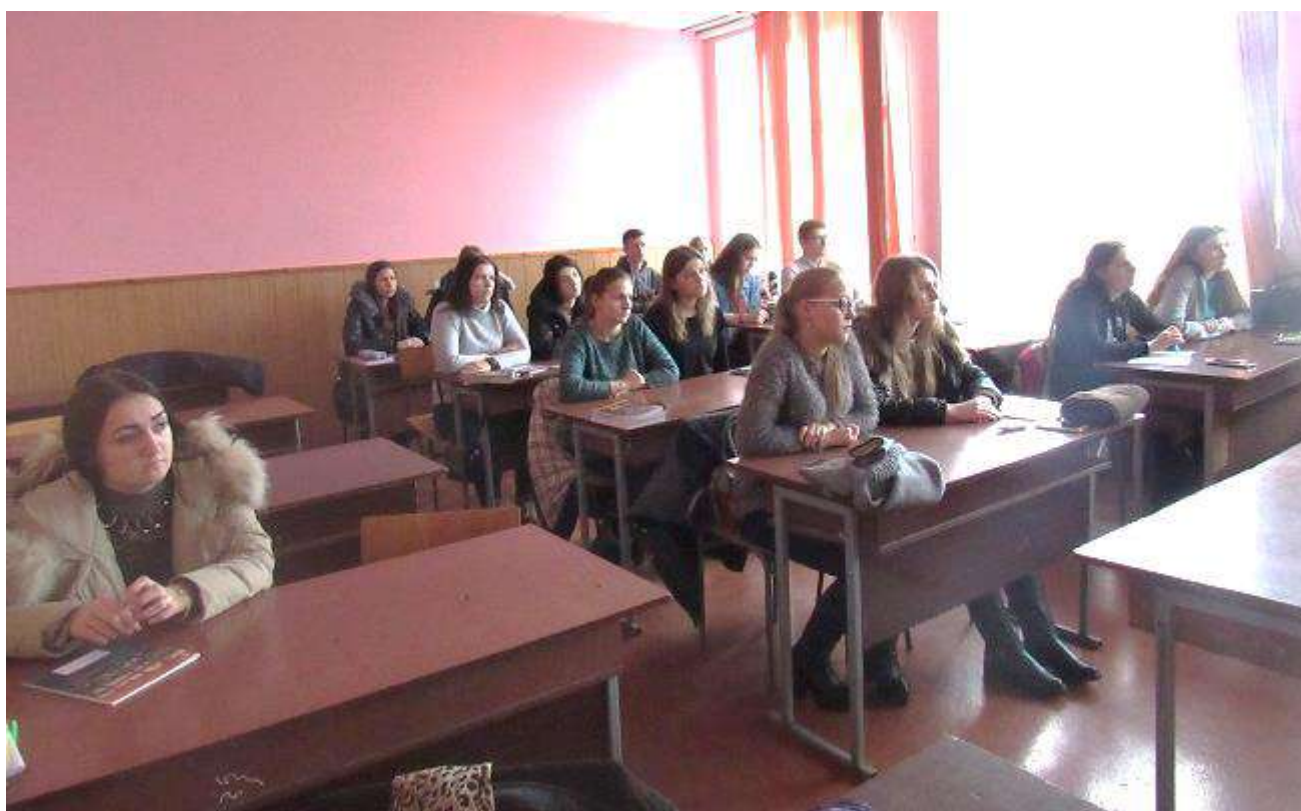
Рівненський коледж Національного університету біоресурсів і природокористування України