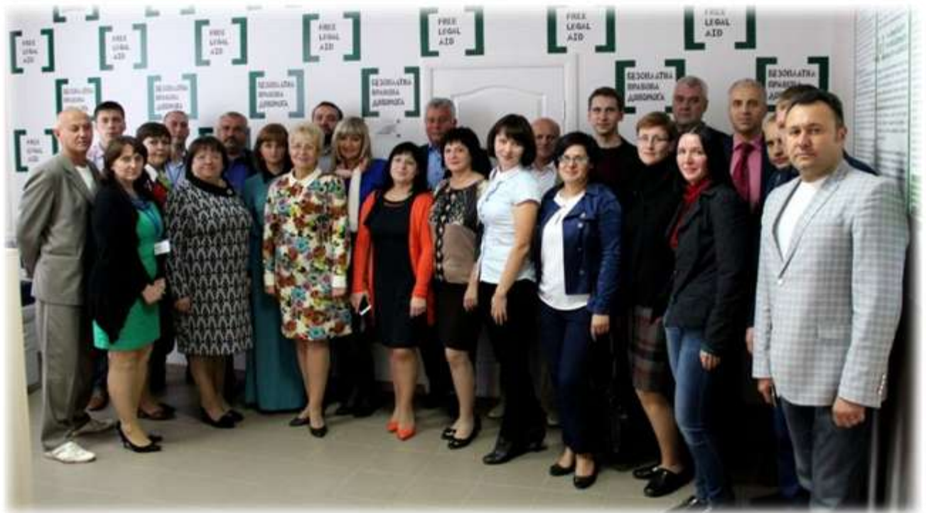
Учасники «круглого столу» в м. Конотоп 16.09.2016

Регіональний центр організував захід у партнерстві з громадською організацією «Громадське бюро «Правозахист» та громадською організацією «Спілка учасників АТО Сумської області» у рамках проекту «Знай! Вимагай! Навчай! Мережа параюристів з питань захисту прав учасників АТО та членів їх сімей» за підтримки Фонду сприяння демократії Посольства США в Україні.