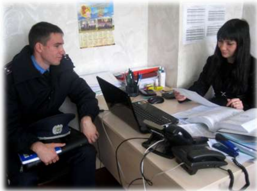
Робота під час звірки

Щокварталу, до 5 числа наступного місяця, проводяться звірки з 19 територіальними підрозділами ГУНП в Сумській області. Звірку проведено до 05.10.2016.