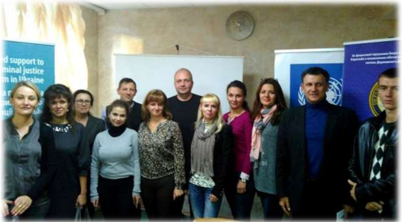
Адвокати Сумщини на презентації результатів моніторингу 23.09.2016, м.Полтава

Презентація відбулася у розвиток пілотного проекту «Моніторинг реалізації нового Кримінального процесуального кодексу України», який в 2014 році проводився в судах м. Києва за ініціативи Уповноваженого з прав людини та за підтримки Ради Європи в рамках проекту «Підтримка реформи кримінальної юстиції в Україні», а також Програми реформування кримінального судочинства та боротьби з корупцією в Україні Департаменту юстиції США та Програми розвитку ООН (ПРООН) в Україні.