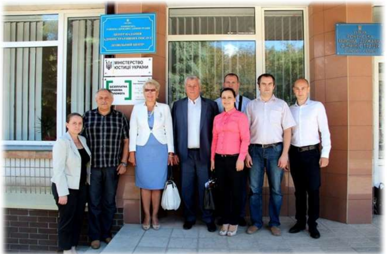
Відкриття Роменського бюро правової допомоги 01.09.2016

Відкриття 14 бюро правової допомоги у кожному районному центрі Сумської області – черговий крок назустріч громаді.