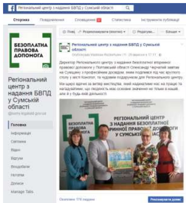
Наша сторінка: https://www.facebook.com/sumy.legalaid.gov.ua/

На сторінці Регіонального центру в соціальній мережі Facebook зроблено 47 публікацій.