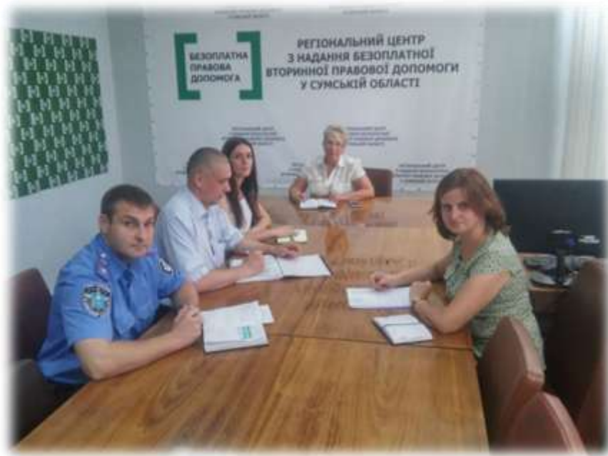
Робоча зустріч 03.08.2016 з представниками Головного управління Національної поліції України