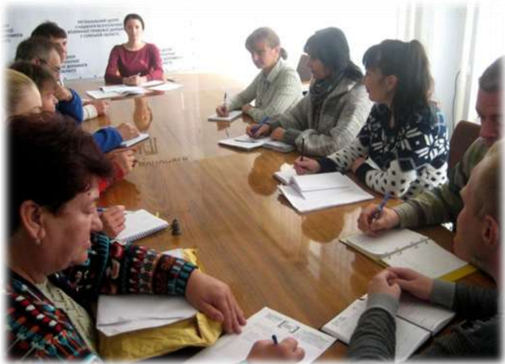
Внутрішнє навчання працівників 30.09.2016

Відповідно до плану були проведені внутрішні навчання працівників.