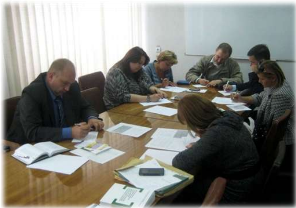
Анкетування під час тренінгу 15.09.2016

У Регіональному центрі 15.09.2016 було проведено психологічний тренінг, на якому адвокати, що співпрацюють з системою БВПД, отримали інформацію про особливості побудови конструктивних стосунків із клієнтами.