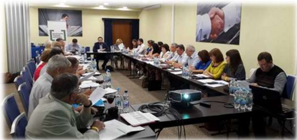
Робоча нарада в м. Київ 14.09.2016

Зустріч керівників Координаційного центру з надання правової допомоги та регіональних центрів з надання БВПД стосувалася питань планово-фінансової діяльності центрів.