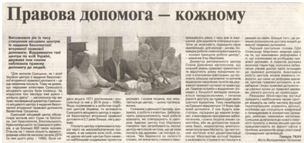
Публікація в газеті «Ярмарок» від 14.07.2016

Щомісяця проводиться наповнення інформаційного дайджесту системи безоплатної правової допомоги в Україні, який знаходиться у вільному доступі за посиланням нижче.