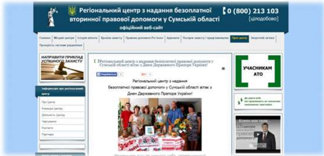
Сайт Регіонального центру з надання безоплатної вторинної правової допомоги у Сумській області

За III квартал 2016 року на сайті Регіонального центру було розміщено 72 інформації.