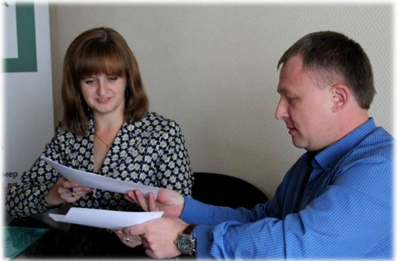
Підписання Меморандуму про співпрацю 28.09.2016