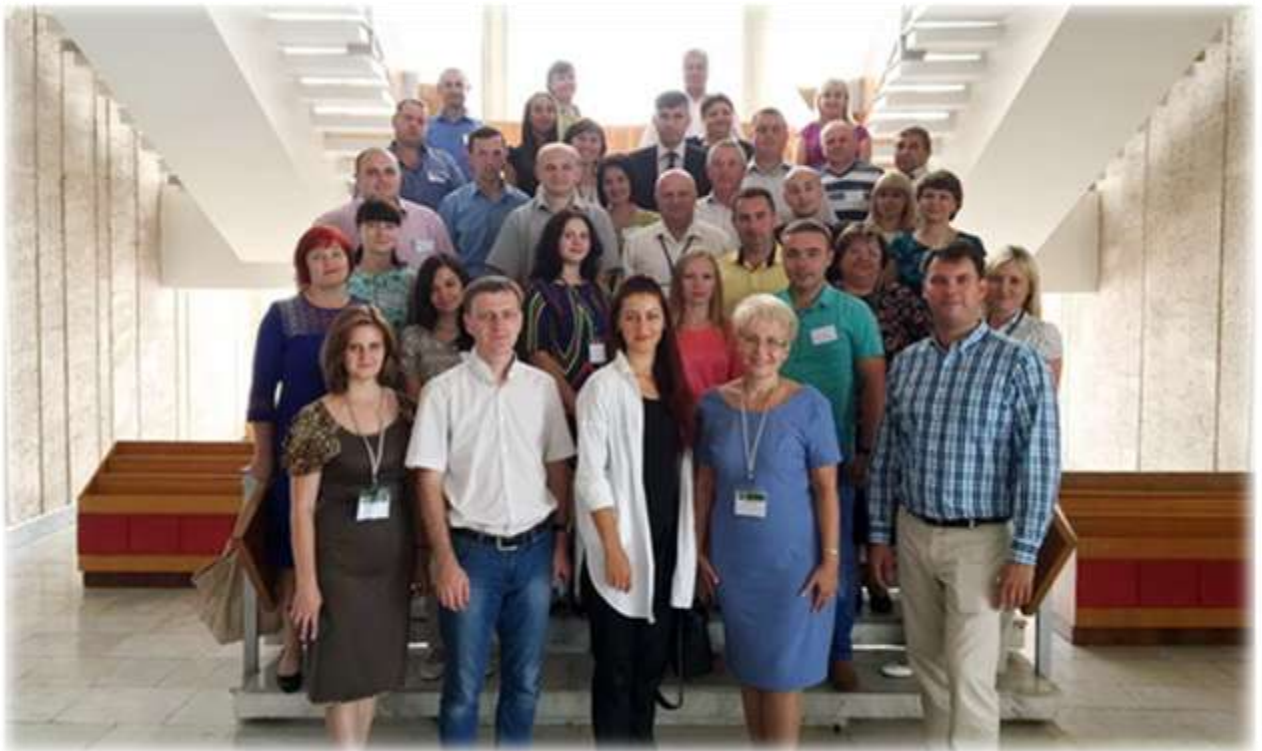
Учасники регіонального установчого семінару 04.08.2016

У м.Суми 04.08.2016 було проведено регіональний установчий семінар для новопризначених працівників бюро правової допомоги у Сумській області.