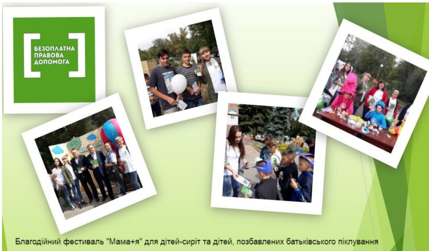
Благодійний фестиваль "Мама+я" для дітей-сиріт та дітей, позбавлених батьківського піклування

Регіональним центром з надання безоплатної вторинної правової допомоги у Кіровоградській області (надалі – Регіональний центр) протягом III кварталу 2018 року з метою посилення правової обізнаності громадян, недопущення порушення їхніх прав проведено низку правопросвітницьких заходів у навчальних закладах, державних установах, на яких представники Регіонального центру розповідали про систему безоплатної вторинної правової допомоги, основні права та обов'язки громадян, новації у законодавстві тощо.