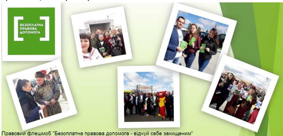
Правовий флешмоб "Безоплатна правова допомога - відчуй себе захищеним"

З метою розповсюдження інформаційно-консультаційних матеріалів у сфері захисту прав, свобод і законних інтересів громадян, правопросвітницької роботи та підвищення правової свідомості населення, а також у рамках загальнонаціонального правопросвітницького проекту «Я МАЮ ПРАВО»