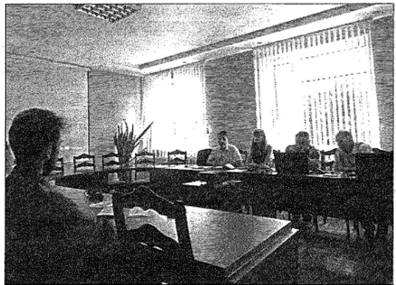
Учасники семінару наочно протестували систему реєстрації.

За словами В'ячеслава Хардікова, в центрі всім охочим надають безкоштовні правові консультації. Також мешканці району можуть скористатися комп'ютерами для вивчення та вирішення юридичних питань.