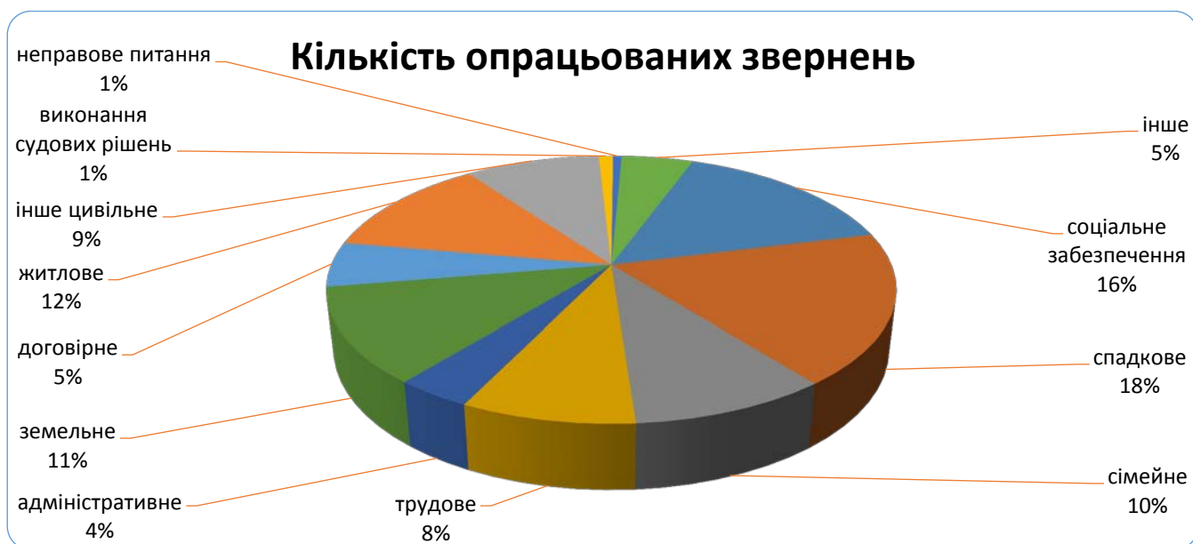
Таблиця 2. Кількість опрацьованих звернень за категоріями питань

Діаграма 2. Кругова діаграма по розподілу клієнтів Менського місцевого центру у III кварталі 2016 року за категорією питання.