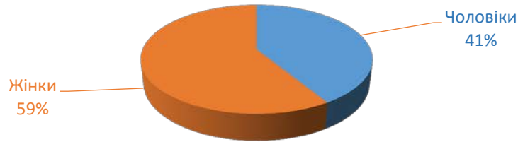
Таблиця 3. Розподіл клієнтів Менського місцевого центру за статтю.