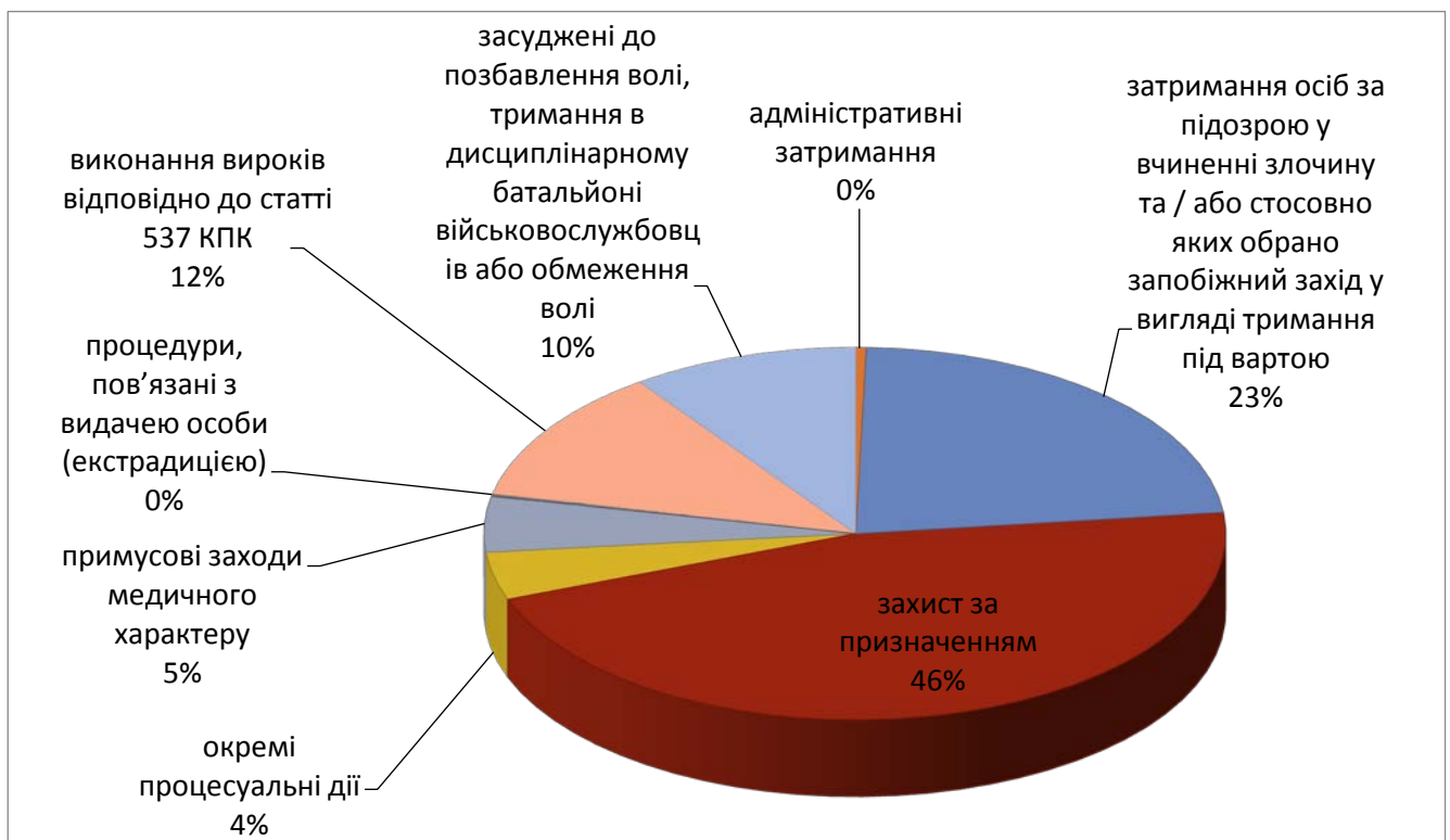
Діаграма 1. Розподіл осіб за категоріями питань у продовж I кварталу 2019 року

З метою підвищення якості надання БВПД регіональним центром у продовж I кварталу 2019 року: