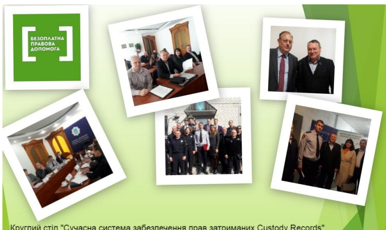
Круглий стіл "Сучасна система забезпечення прав затриманих Custody Records"

Про сучасну систему забезпечення прав затриманих Custody Records, яка запрацювала в ізоляторі тимчасового тримання у Кропивницькому, говорили сьогодні, 19 жовтня під час круглого столу, який пройшов у Головному управлінні Національної поліції у Кіровоградській області.