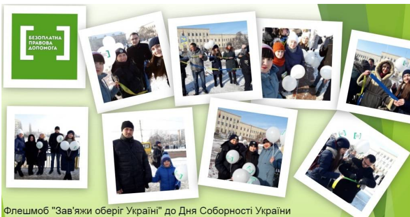
Флешмоб "Зв'яжи оберег України" до Дня Соборності України

http://n-slovo.com.ua/2019/03/20/%D1%83-%D1%81%D0%B8%D1%81%D1%82%D0%B5%D0%BC%D1%96-%D0%B1%D0%B5%D0%B7%D0%BE%D0%BF%D0%BB%D0%B0%D1%82%D0%BD%D0%BE%D1%97-%D0%BF%D1%80%D0%B0%D0%B2%D0%BE%D0%B2%D0%BE%D1%97-%D0%B4%D0%BE%D0%BF%D0%BE%D0%BC/?fbclid=IwAR1PU6JGYGb1GvsEwVC785UFcDnjpDKNS0EvmU7Lu6fVoOOXNP9GOIfgq