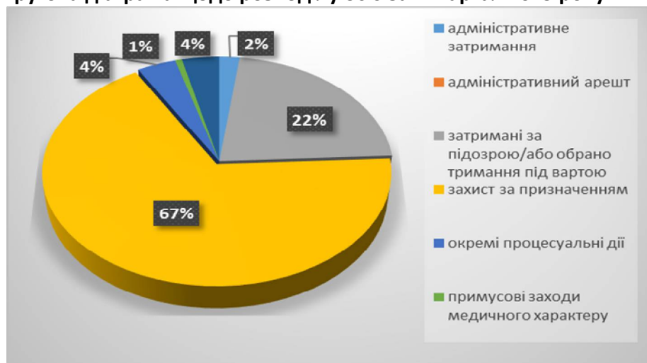
Діаграма 1. Кругова діаграма щодо розподілу осіб за I квартал 2019 року.