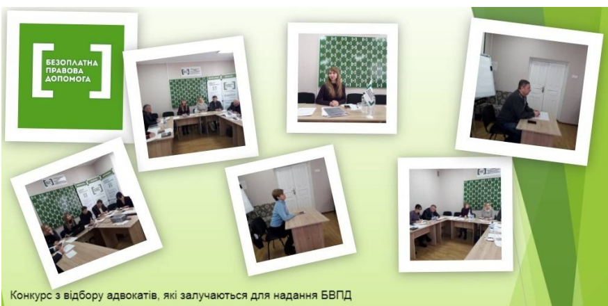
Конкурс з відбору адвокатів, які залучаються для надання БВПД

Протягом січня 2019 року у приміщенні Регіонального центру з надання безоплатної вторинної правової допомоги у Кіровоградській області проходив XI конкурс з відбору адвокатів, які залучаються для надання безоплатної вторинної правової допомоги.