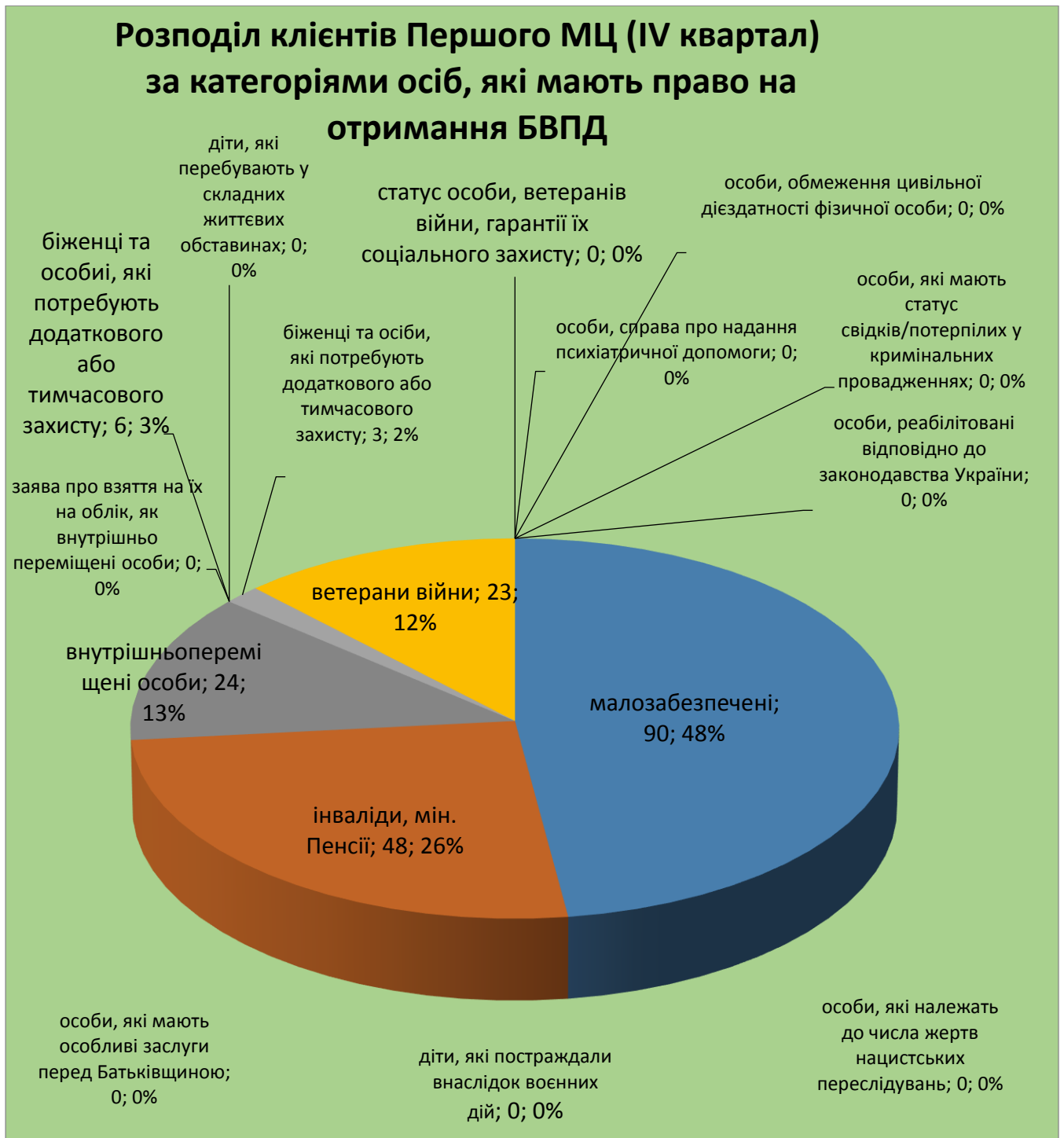
Діаграма 5. Щодо розподілу клієнтів, яким надано БВПД, за категорією осіб