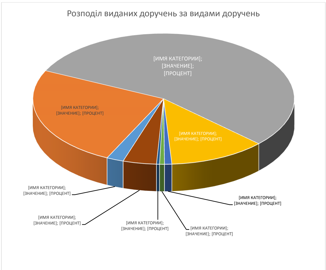
Діаграма 1. Кругова діаграма по розподілу кількості виданих доручень за видами доручень:

З метою підвищення якості надання БВПД регіональним центром з 01.04.2016 року по 30.06.2016 року: