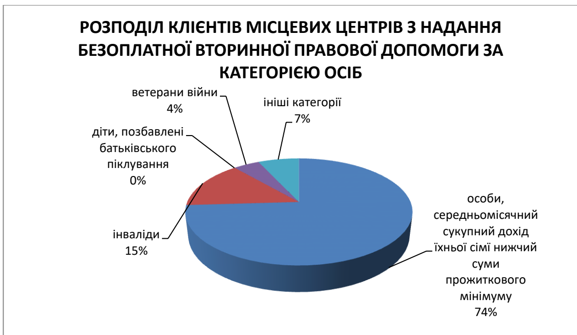
Діаграма 8. Щодо розподілу клієнтів, яким було надано БВПД, за категорією осіб

Щодо клієнтів, яким було надано БВПД, то за 1й квартал 2017 року найбільше позитивних рішень було прийнято по інвалідам 23 (15%), малозабезпеченим особам (середньомісячний дохід не перевищує двох розмірів прожиткового мінімуму) 117 (74%) та ветеранам війни 7 (7%) тощо.