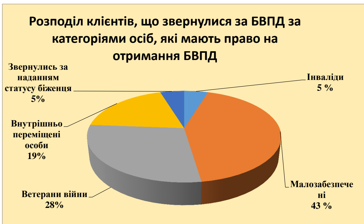
Діаграма 1 щодо розподілу клієнтів за категорією осіб

Звернень від інвалідів, які отримують пенсію, допомогу, що нижча двох прожиткових мінімумів - 1 (5%) , осіб, середньомісячний сукупний дохід їхньої сім'ї нижчий суми двох прожиткових мінімумів - 9 (43%) , внутрішньо переміщені особи – 4 (19%) , особи на яких поширюється дія Закону України «Про біженців та осіб, які потребують додаткового або тимчасового захисту» - 1 (5%) , ветерани війни та особи, на яких поширюється дія Закону України «Про статус ветеранів війни, гарантій їх соціального захисту» - 6 (28%)