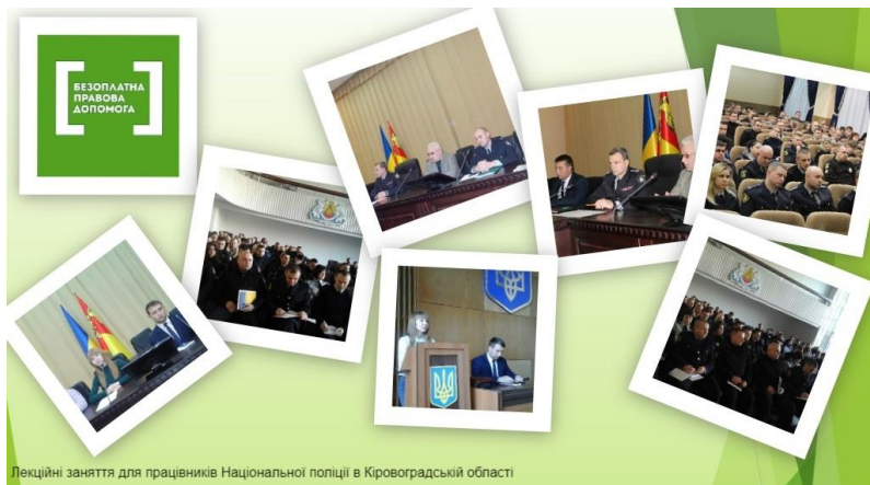
Лекційні заняття для працівників Національної поліції в Кіровоградській області

З метою забезпечення реалізації державної політики у сфері захисту прав людини та запобігання порушенням конституційних прав та свобод громадян, 7-8 грудня 2017 року, фахівці Регіонального центру з надання безоплатної вторинної правової допомоги у Кіровоградській області взяли участь лекційних заняттях для працівників апарату Головного управління Національної поліції в Кіровоградській області та