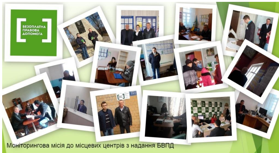
Моніторингова місія до місцевих центрів з надання БВПД

За результатами проведеного моніторингу істотні зауваження до діяльності місцевого центру з надання БВПД, у тому числі бюро правової допомоги, відсутні, про що складений відповідний звіт.