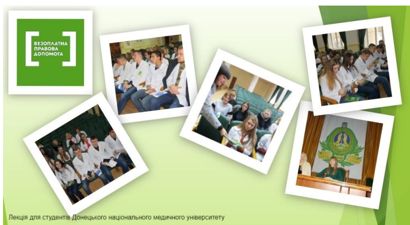
Лекція для студентів Донецького національного медичного університету

http://kirovohrad.legalaid.gov.ua/ua/holovna/u-kropyvnytskomu-hovoryly-pro-realizatsiiu-prava-na-zakhyst