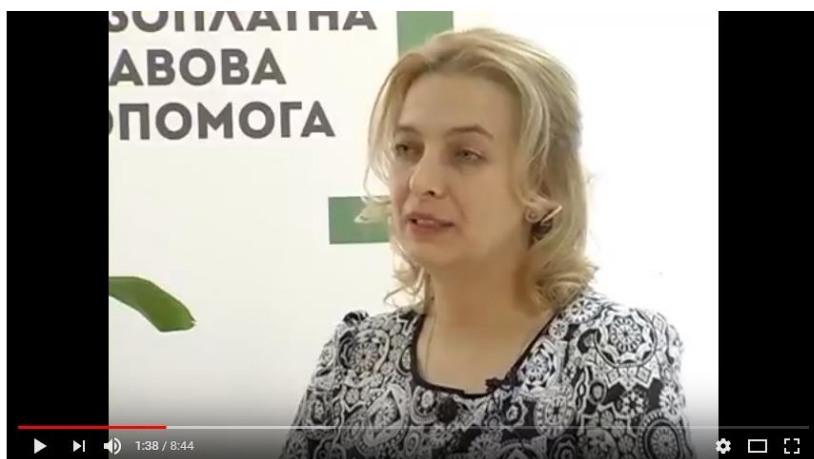
Адвокатські кейси 04.11.2017

https://www.youtube.com/watch?v=5SI_-Oa3z14&feature=youtu.be