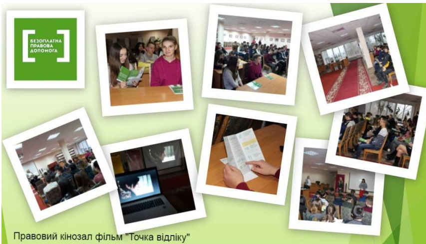
Правовий кінозал фільм "Точка відліку"

Права людини крізь призму документального фільму обговорювали під час правопросвітницького заходу «Правовий кінозал» фахівчині Регіонального центру з надання БВПД у Кіровоградській області зі студентами Будівельного коледжу.