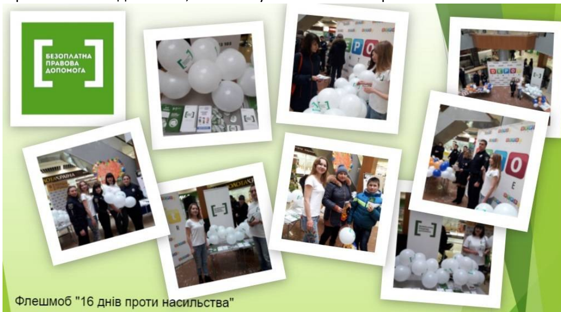
Флешмоб "16 днів проти насильства"

З метою підвищення правової обізнаності мешканців територіальних громад та надання їм правових послуг спрямованих на забезпечення реалізації та захисту прав і свобод людини фахівці системи БПД систематично проводили "вуличне інформування" жителів районів щодо роботи системи безоплатної правової допомоги та поширювали інформаційні матеріали в громадському транспорті, приміщеннях органів державної влади та місцевого самоврядування тощо. На всіх заходах громадянам роздаються друківані матеріали, які містять інформацію щодо правових послуг, які надають центри правової допомоги, перелік підтверджуючих документів, які дають право на отримання такої допомоги, а також буклети з найпоширенішими питаннями.