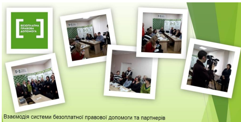
Взаємодія системи безоплатної правової допомоги та партнерів

В обговоренні та пошуку шляхів вирішення питання створення притулку для жертв домашнього насильства взяли участь представники органів державної влади, державних організацій, депутатського корпусу, громадських організацій, поліції.