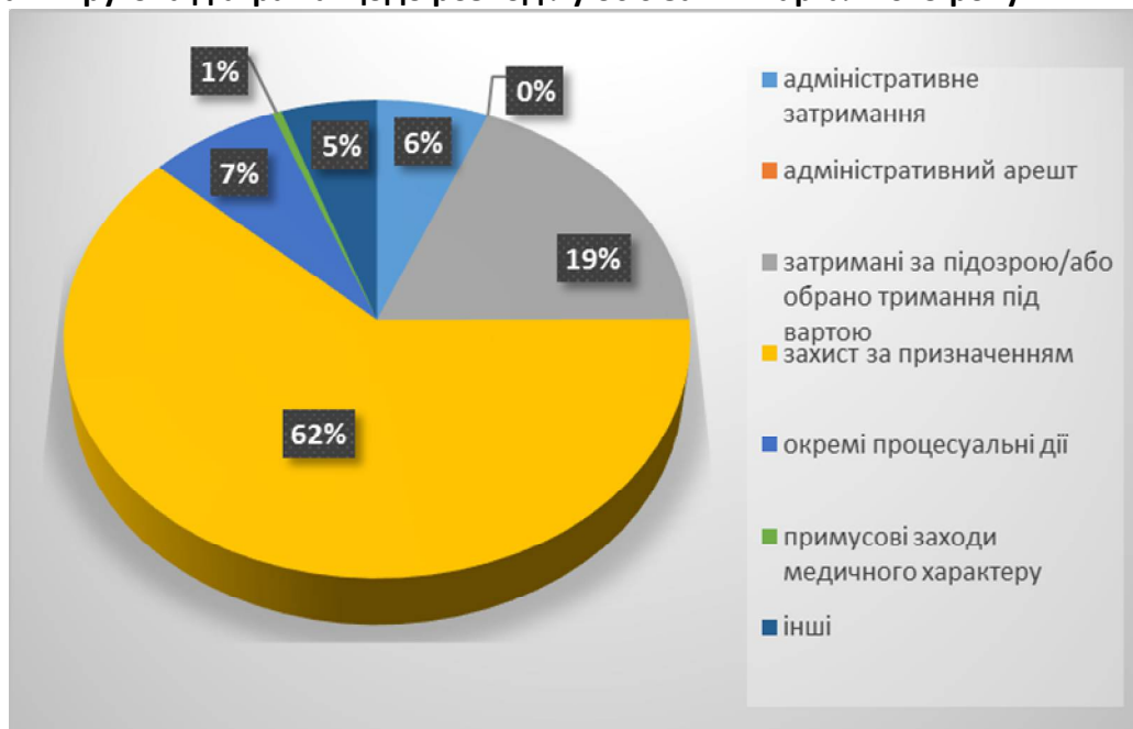
Діаграма 1. Кругова діаграма щодо розподілу осіб за VI квартал 2019 року.