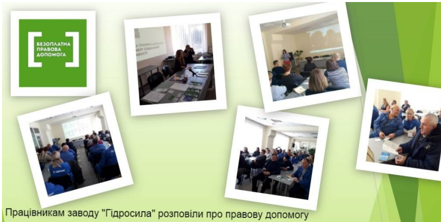
Працівникам заводу "Гідросила" розповіли про правову допомогу