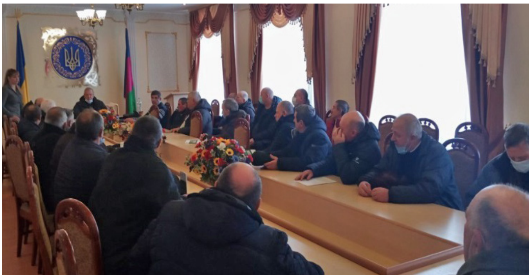
На фото учасники зборів громадської організації «Спілка учасників аварії на Чорнобильській АЕС».

Після проведення інформаційної частини бажаючі змогли отримати юридичні консультації. За правовою допомогою звернулося 18 осіб, а також прийнято 8 звернень на безоплатну вторинну правову допомогу.