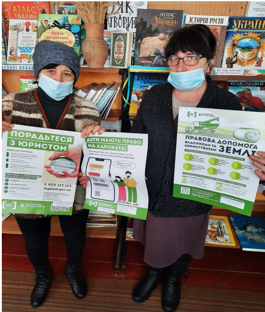
Працівники комунальної установи "Талалаївська централізована бібліотечна система".

На завершення фахівці залишили інформаційні буклети, тематичні плакати системи БПД із зазначенням контактних телефонів, адреси бюро розміщенні в установах та організаціях громади.