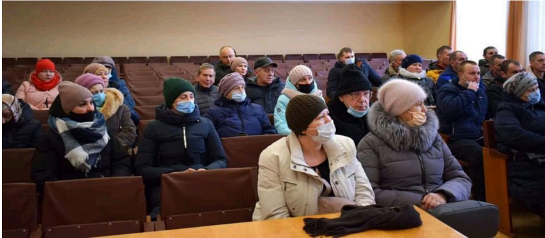
На фото учасники зібрання мешканців громади щодо відсутності належного теплопостачання житлових будинків.

Невід'ємною частиною діяльності Ніжинського МЦ та бюро правової допомоги є проведення інформаційно-роз'яснювальних та комунікативних заходів для різних категорій населення.