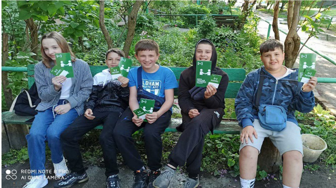
На Фото інформування громадян м. Прилуки

З метою проведення інформаційно-роз'яснювальної роботи та поширення інформації про систему БПД працівники бюро проводять вуличне інформування громадян Ніжинського та Прилуцького районів.