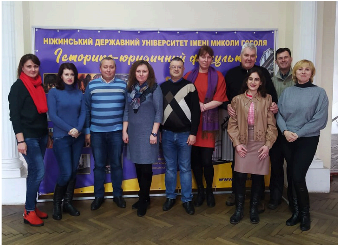
На фото учасники зустрічі працівники Ніжинського МЦ з надання БВПД та історико-юридичного факультету Ніжинського державного університету імені Миколи Гоголя