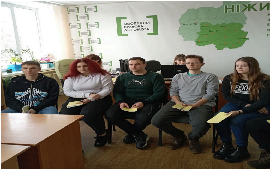
На Фото студенти історико- юридичного факультету Ніжинського державного університету імені Миколи Гоголя