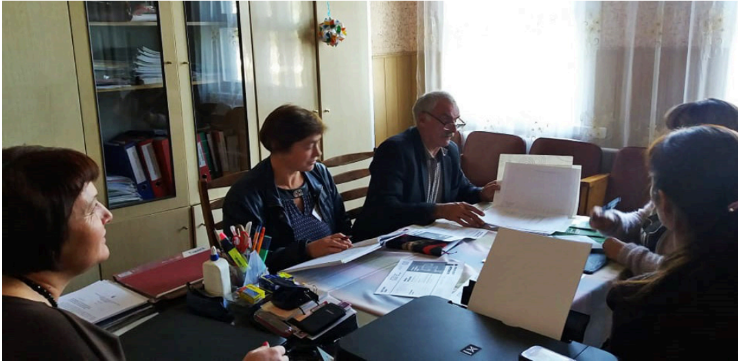
На фото працівники Гмирянського старостинського округу під час спільного прийому громадян

На Талалаївщині підвищують рівень правової обізнаності громадян. З метою підвищення рівня правової обізнаності громадян про зміни до земельного законодавства, а також надання консультаційної підтримки, працівниці сектору «Талалаївське бюро правової допомоги» щомісячно проводять інформаційно-роз'яснювальну роботу та забезпечують роботу консультаційних пунктів прийому громадян у приміщеннях комунальної установи «Центр надання соціальних послуг» Талалаївської об'єднаної територіальної громади та Прилуцького районного сектору № 4 філії «Центр пробації» в Чернігівській області.