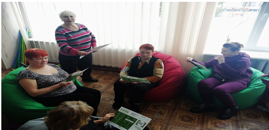
На фото підопічні Територіального центру соціального обслуговування (надання соціальних послуг) Ніжинської міської ради Чернігівської області.

З метою забезпечення інформаційної присутності системи БПД у місцях несовбоди соціальної сфери працівники Ніжинського МЦ з надання БВПД поширили, розмістили плакати і буклети правової тематики у приміщеннях відділень Територіального центру соціального обслуговування (надання соціальних послуг) Ніжинської міської ради Чернігівської області та Центру комплексної реабілітації для дітей з інвалідністю «Віра» .