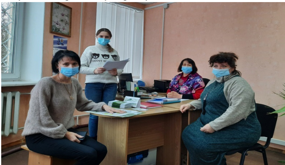
На Фото працівники комунальної установи «Центр надання соціальних послуг» під час семінару.

Протягом кварталу проведені семінари на теми: «Порядок спадкування земельної ділянки», «Порядок укладення договору дарування земельної ділянки», «Усунення перешкод у користуванні земельною ділянкою».