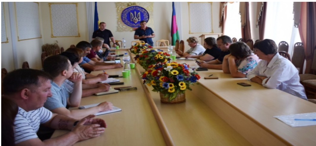
На Фото учасники навчання з цивільного захисту

На завершення учасники заходи отримали буклети системи БПД із зазначенням контактних телефонів, адреси розміщення бюро.