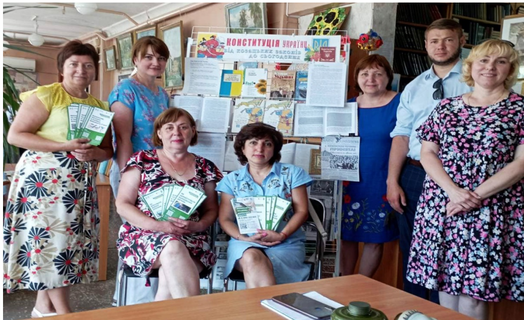
На фото працівники Ніжинського МЦ з надання БВПД та колектив Ніжинської міської ЦБС

З метою проведення інформаційно-роз'яснювальної роботи та поширення інформації про систему БПД працівники бюро проводять вуличне інформування громадян Ніжинського та Прилуцького районів.