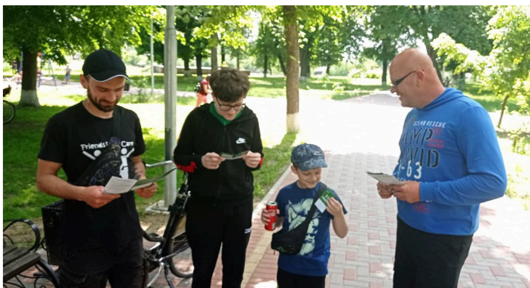
На Фото інформування громадян Ічнянської ОТГ

Під час спілкування із громадянами спеціалісти розповідають про Закон України «Про безоплатну правову допомогу», порядок отримання послуг адвоката за рахунок держави, роздають інформаційні буклети із зазначенням контактних телефонів та адреси розміщення бюро.