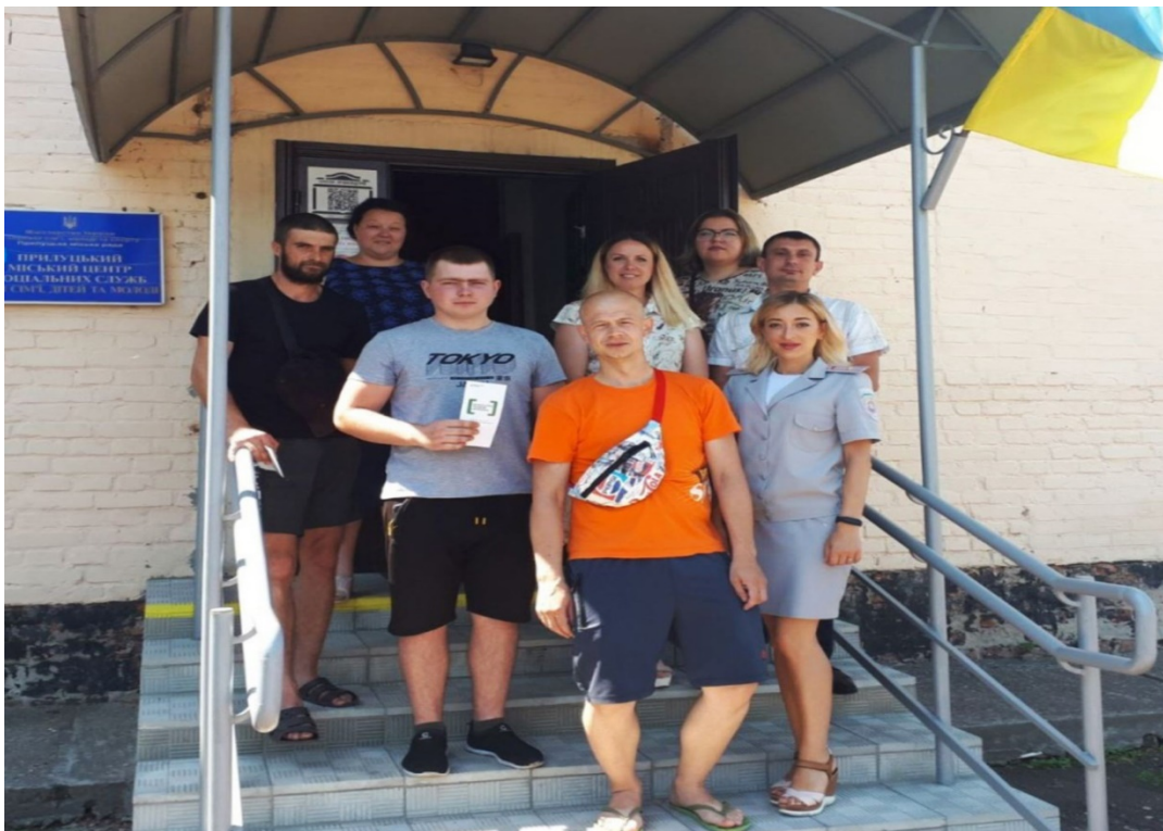
На фото учасники заходу «Профілактика повторних правопорушень».

З метою підвищення рівня правової обізнаності громадян правничня розмістила у приміщенні Центру соціальних служб Прилуцької міської ради Чернігівської області плакати та буклети системи БПД.