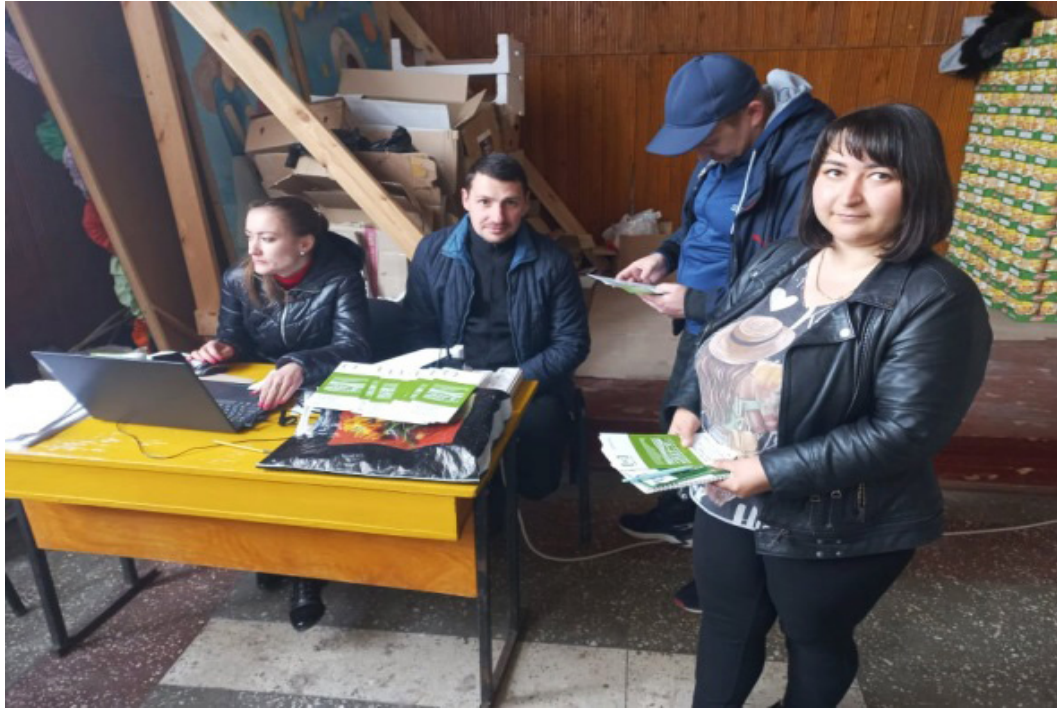
На фото учасники заходу, працівниками Центру допомоги Ічнянської міської ради.

Традиційно 1 червня Україна та світ відзначає Міжнародний день захисту дітей. До участі у заходах долучилися працівники Ніжинського місцевого центру з надання безоплатної вторинної правової допомоги.