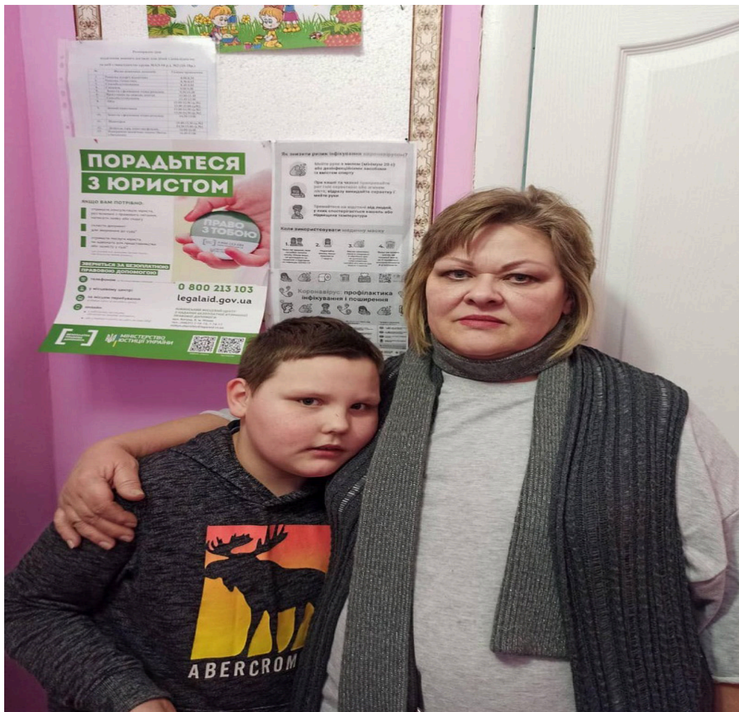
Підопічні комунальної установи «Центр комплексної реабілітації для дітей з інвалідністю «Віра» .

Поняття «місця несвободи» значно ширше, ніж поняття «місця позбавлення волі», яке має під собою позбавлення волі лише як вид покарання. В Україні до місць несвободи також належать військові частини, психіатричні заклади, пункти тимчасового розміщення біженців, будинки дитини, дитячі будинки-інтернати, притулки для дітей, дитячі будинки, загальноосвітні школи-інтернати для дітей-сиріт і дітей, позбавлених батьківського піклування, центри соціальної реабілітації дітей-інвалідів, центри соціально-психологічної реабілітації дітей; психоневрологічні інтернати тощо.