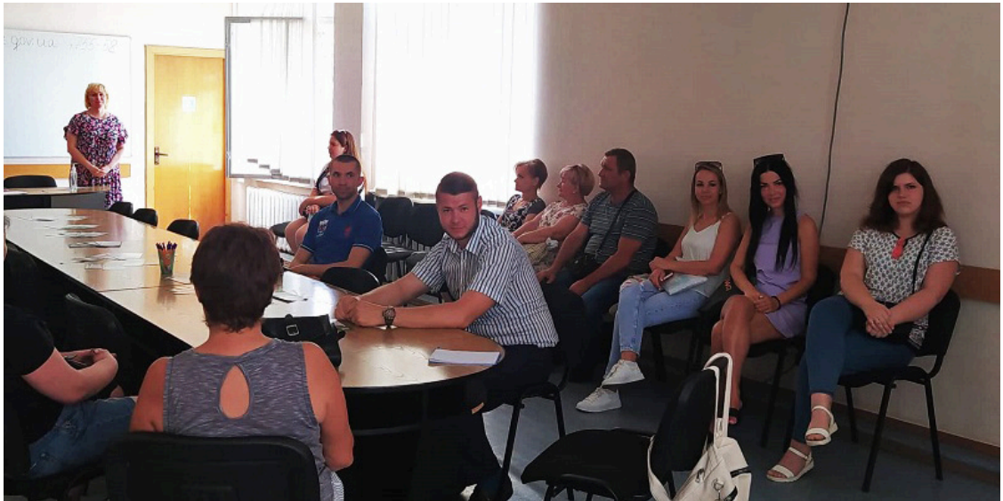
На фото учасники заходу, особи, що перебувають на обліку у Ніжинському міськрайонному центрі зайнятості