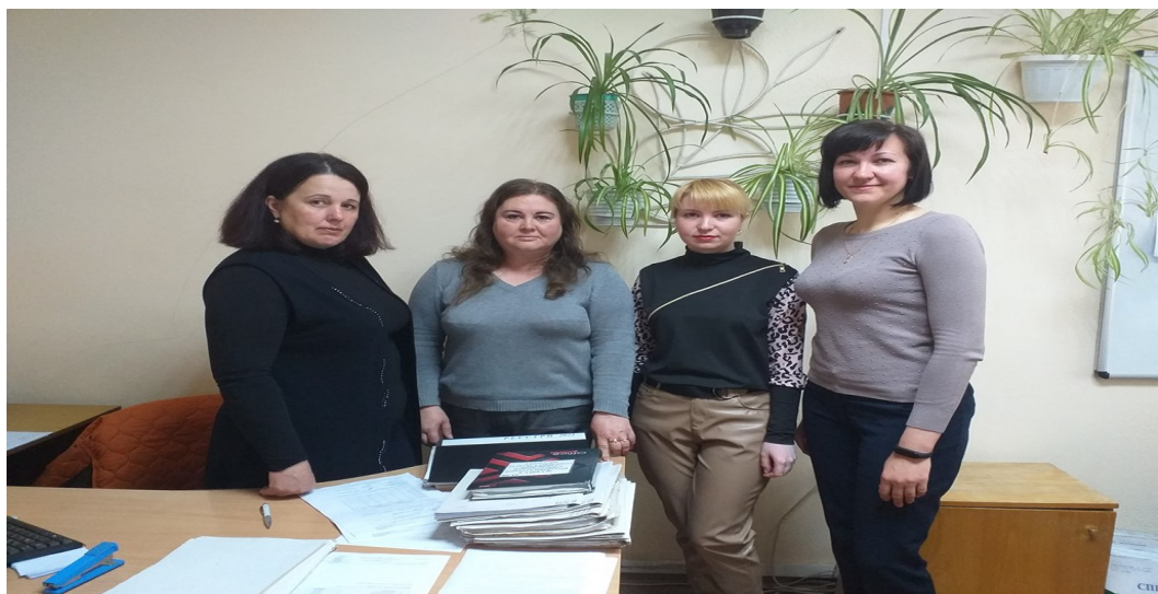
На Фото працівники Талалаївського відділу соціальної підтримки громадян управління соціального захисту населення Прилуцької РДА

Під час проведення заходів присутні детально зупинилися на обговоренні актуальних питань сьогодення: «Порядок отримання компенсації за зруйноване житло та інше майно», «Протидія сексуальному та гендерному насильству в умовах конфлікту в Україні» тощо.