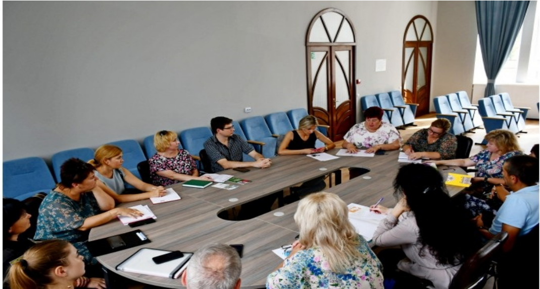
На фото учасники наради, що відбулася у Ніжинській міській раді.