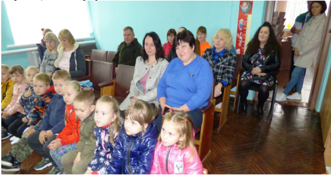
На фото учасники заходу, що відбувся у КЗ «Публічна бібліотека» Борзнянської міської ради

В умовах воєнного стану найзручніший спосіб отримати консультацію – це зателефонувати за єдиним номером 0 800 213 103 (дзвінки безкоштовні у межах України) або звернутися онлайн.