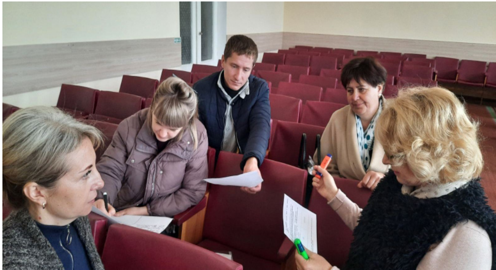
На фото учасники тренінгу, який організували представники громадської організації «ЛА СТРАДА-УКРАЇНА».