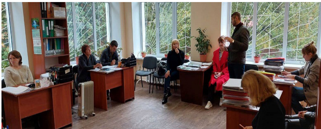
Учасники заходу представниками Ніжинського міського центру соціальних служб для сім'ї, дітей та молоді

Під час заходу присутні обговорили шляхи подальшої співпраці та актуальні питання сьогодення, а саме: взаємодія суб'єктів, що здійснюють заходи у сфері запобігання та протидії домашньому насильству; алгоритм дій під час звернення постраждалої особи, яка постраждала від домашнього насильства та /або насильства за ознакою статі; інформування громадян про необхідність фіксування воєнних злочинів, відшкодування матеріальної шкоди та збитків, завданих Україні внаслідок збройної агресії РФ; дії родичів військовослужбовців, які зникли безвісти чи потрапили у полон; правила перетину кордону дітям до 18 років.