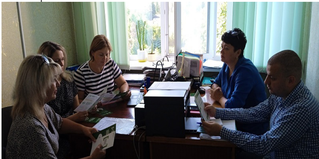
На фото колектив служби у справах дітей Сухополов'янської сільської ради

Сторони домовилися про співпрацю, зокрема, дійшли домовленості щодо направлення до Прилуцького бюро безоплатної правової допомоги потерпілих від домашнього насильства для подальшої юридичної допомоги і захистом своїх прав та інтересів.