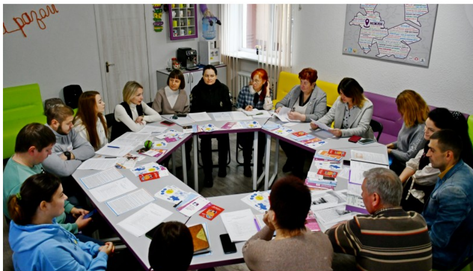
На фото учасники заходу

У ході круглого столу розглянули ряд важливих питань: посилення спроможності ОМС щодо покращення доступу до необхідної соціально-психологічної допомоги як місцевим мешканцям так і ВПО; здійснення заходів щодо попередження насильства в сім'ї в умовах воєнного часу; реалізація програми по роботі з кривдниками; посилення координації взаємодії суб'єктів, що здійснюють заходи у сфері запобігання та протидії домашньому насильству на місцевому рівні; новели законодавства про запобігання та протидію домашньому насильству тощо.