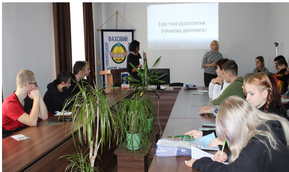
На фото учасники заходу під час перегляду презентації у Ніжинського фахового коледжу НУБіП України.