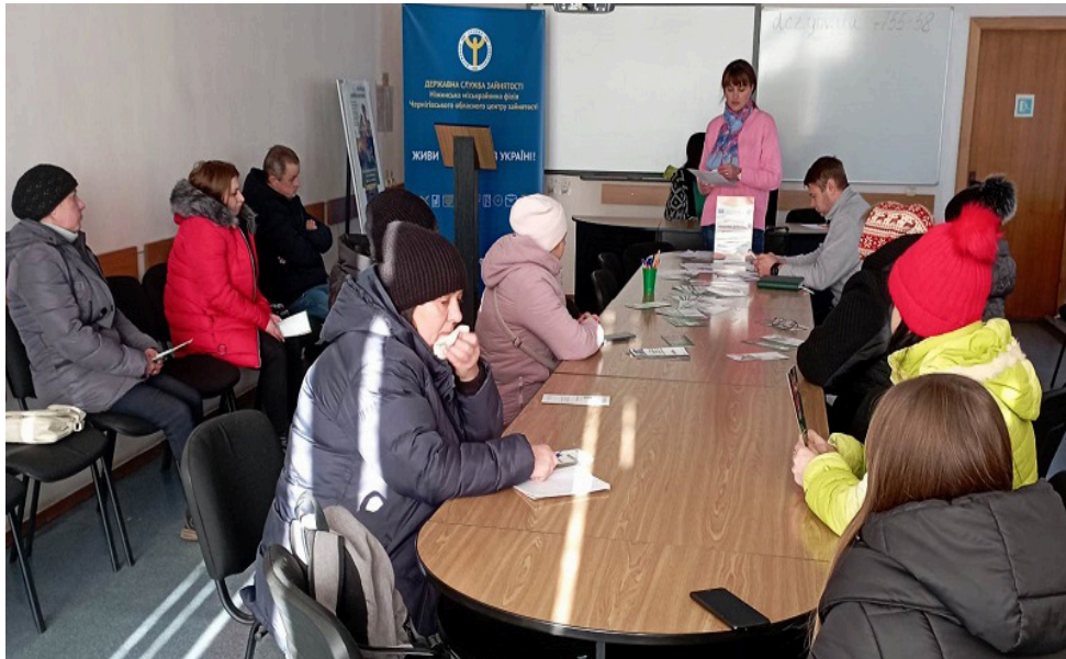
На Фото головний юрист Ніжинського бюро правової допомоги під час семінару у Ніжинському міськрайонному центрі зайнятості