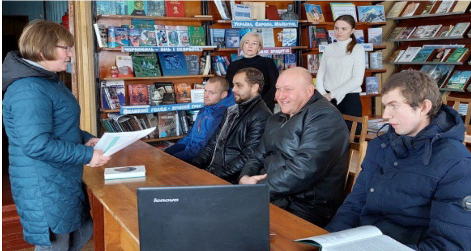
На фото учасники заходу під час обговорення

відповідних платформах Міністерства юстиції України, а також залишила інформаційні буклети системи БПД із зазначенням контактних телефонів та адресою розміщення бюро.