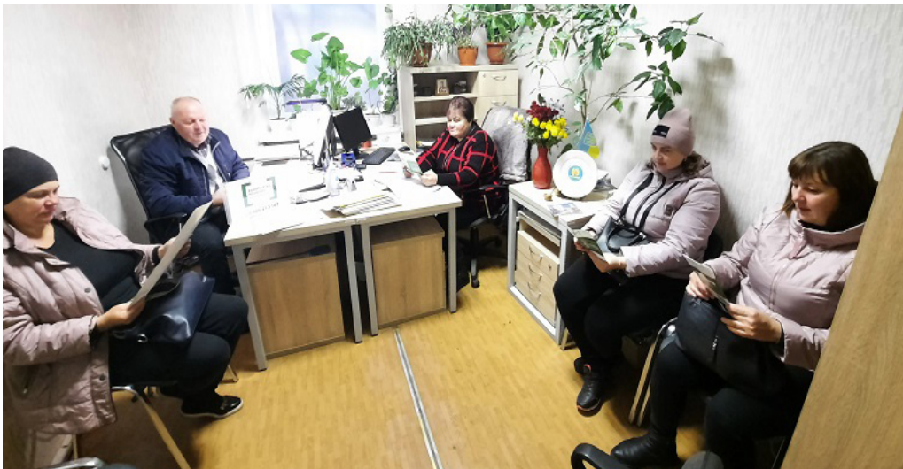
Учасники заход, що відбувся у приміщенні комунальної установи «Центр надання соціальних послуг» Талалаївської об'єднаної територіальної громади

Окрім того, в ході спілкування із працівниками та відвідувачами установ правчиня розповіла про трудові гарантії, пільги для військовослужбовців, дострокове розірвання договору оренди землі в умовах воєнного стану, а також пояснила, що таке «воєнні злочини», як їх фіксувати на відповідних платформах Міністерства юстиції України.