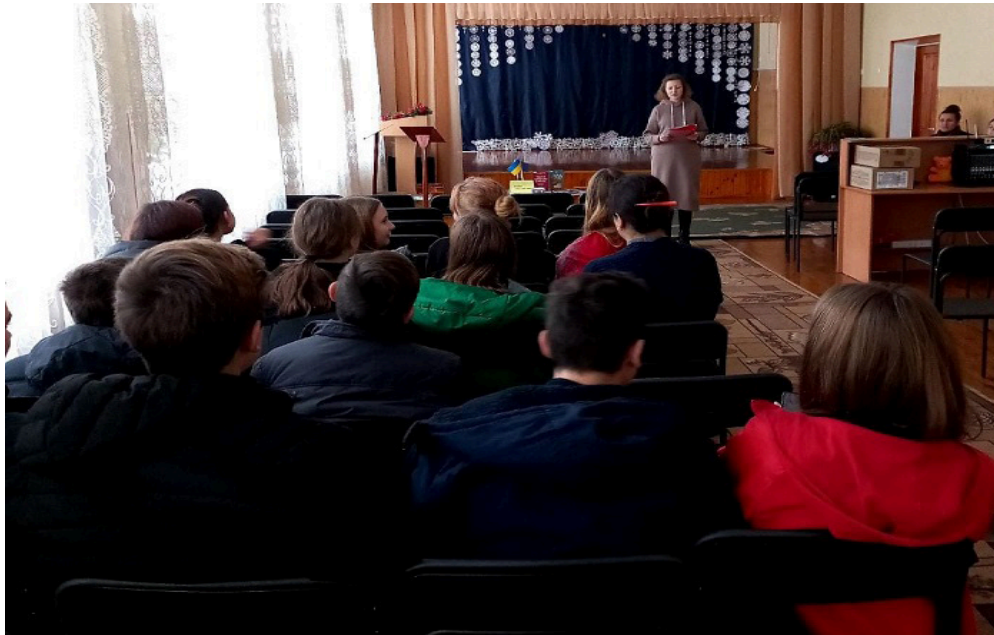
На фото учасники заходу, що відбувся у КЗ «Публічна бібліотека» Борзнянської міської ради

Окрім того, присутні активно відповідали на питання вікторини, приймали участь у правові ігри, обговорювали змодельовані життєві ситуації, а також наслідки та відповідальність за вчинення протиправних дій.