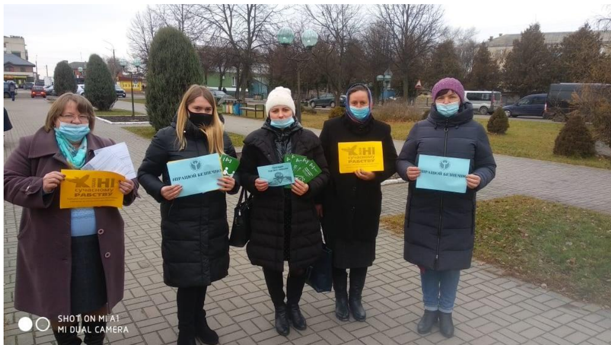
Фахівець Камінь-Каширського бюро правової допомоги під час проведення вуличного інформування населення.

Всі присутні були одностайні в тому, що проблема насильства у сім'ї дуже актуальна на сьогодні у нашому суспільстві, потребує послідовної, постійної, ціле направленої роботи по її вирішенню.