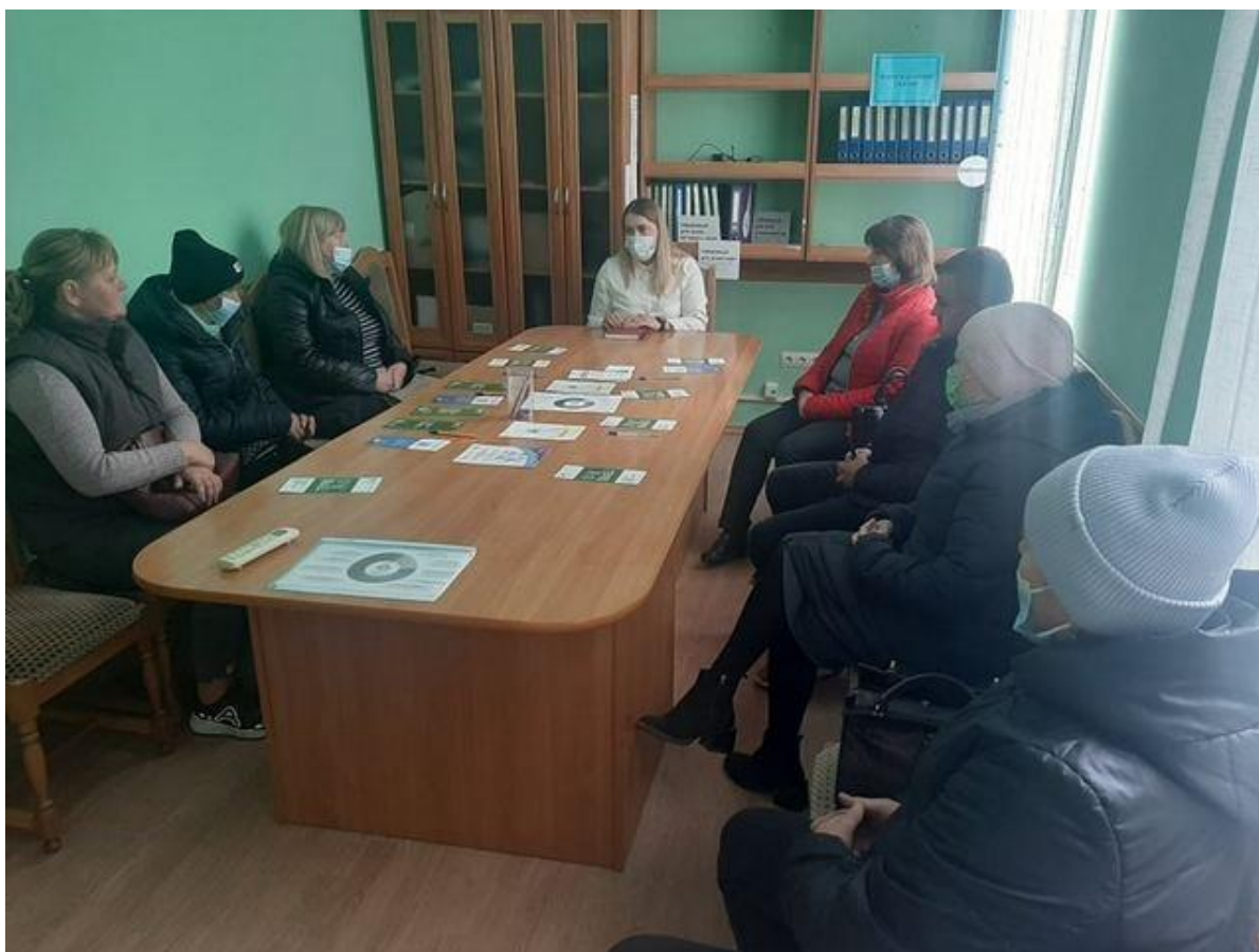
Начальник Камінь-Каширського бюро правової допомоги під час проведення семінару для безробітних Камінь-Каширській районній філії Волинського обласного центру зайнятості

Під час проведення зустрічі було розповсюджено відповідні інформаційні буклети.