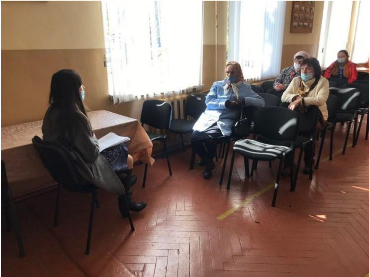
Фахівець Ковельського місцевого центру з надання безоплатної вторинної правової допомоги під час зустрічі зі студентами університету третього віку

Проведення правопросвітницьких семінарів на базі ОМС для жителів громад, спрямованих на роз'яснення змісту ключових реформ (змін у законодавстві) у сфері соціального захисту, освіти, охорони здоров'я, пенсійного забезпечення, а також актуальних питань життя громад, зокрема: захисту прав споживачів комунальних послуг, організації ОСББ, безоплатного отримання земельних ділянок, громадської безпеки із залученням партнерів з числа громадських організацій, державних установ та комунальних установ органів державної влади та місцевого самоврядування, та інших відповідно до потреби