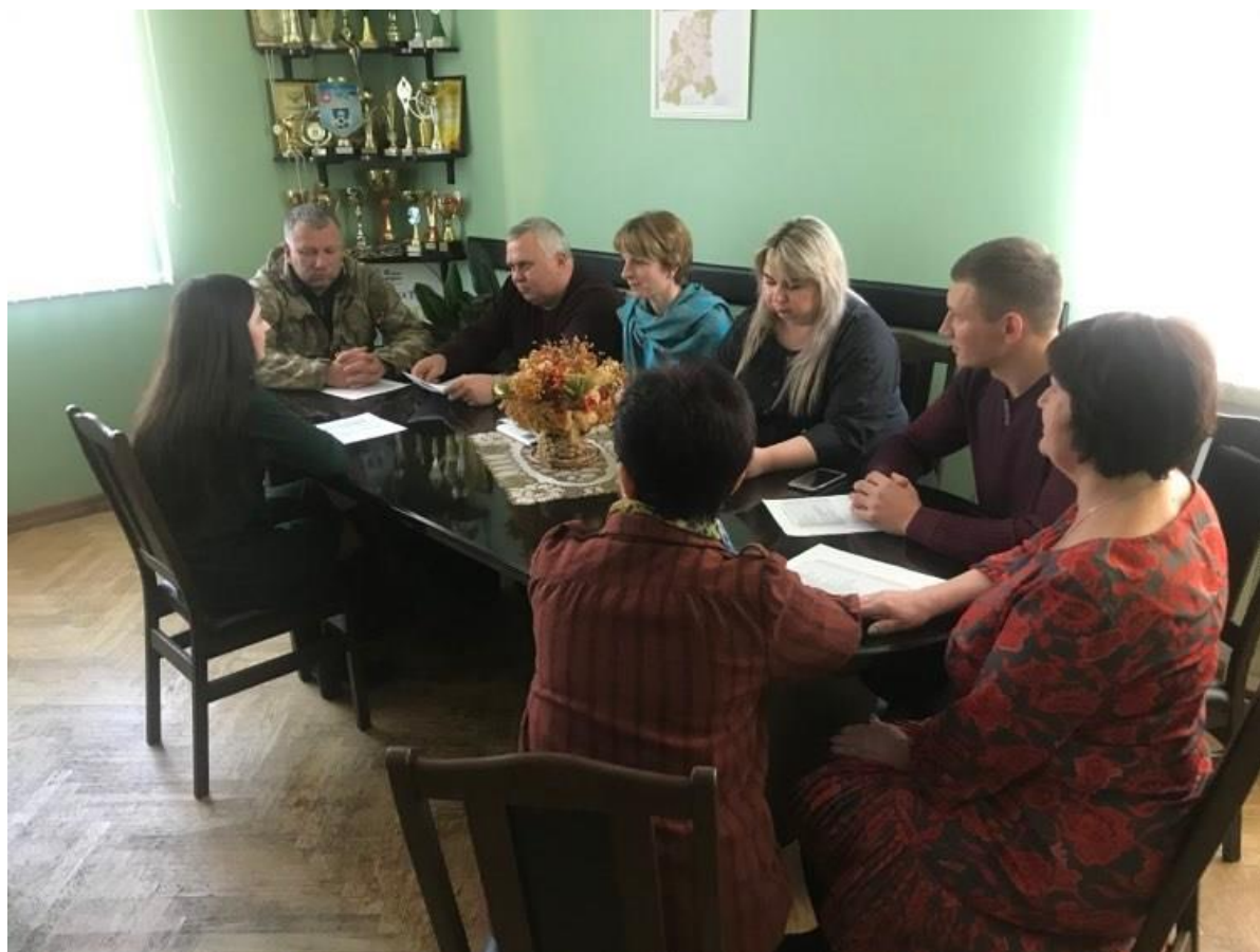
Фахівець центру консультує жителів с.Колодяжне з питань, пов'язаних із земельним законодавством

Після цього кожен бажаючий отримав індивідуальну консультацію з власного питання