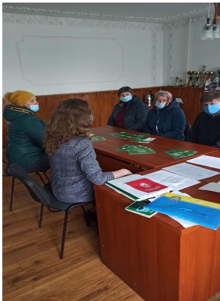
Фахівець Старовижівського бюро під час проведення просвітницького заходу на базі Старовижівської селищної ради

Під час зустрічі фахівець Бюро розповіла слухачам про можливість адресного консультування осіб похилого віку та осіб з інвалідністю, які не мають можливості звернутися до бюро правової допомоги чи місцевого центру. Окрім цього присутнім було надано індивідуальні консультації щодо питань соціального та пенсійного забезпечення.