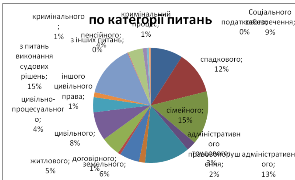
Діаграма 1 щодо розподілу клієнтів за звітний квартал за категорією питань.

В звітному кварталі клієнти зверталися частіше з наступних питань: соціального забезпечення 131 (9%), спадкового 173 (12%), сімейного 217 (15%), трудового 39 (3%), адміністративного 183 (13%), адміністративне правопорушення 25 (2%), земельного 80 (6%), договірною 11 (1%), житлового 78 (5%), цивільного 116 (8%), цивільно-процесуального 61 (4%), іншого цивільного права 20 (1%), з питань виконання судових рішень 211 (15%), з інших питань 4 (0%), пенсійного 60 (4%), кримінального 16 (1%), кримінальний процес 9 (1%).