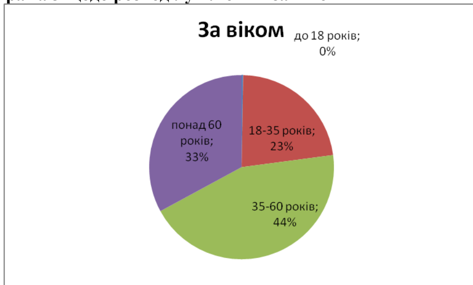
Діаграма 3 щодо розподілу клієнтів за віком

до 18 років - 4 особи; 18-35 років - 326 осіб; 35-60 років - 637 осіб; 60 років - 474 осіб.