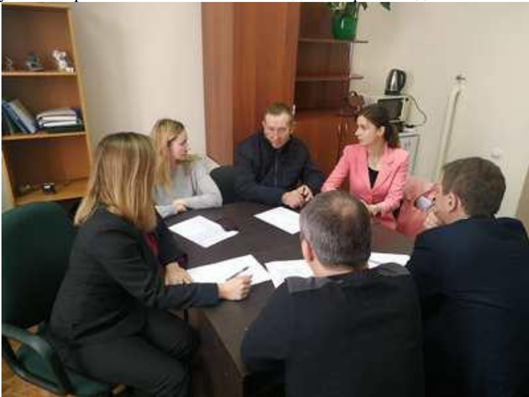
Заступник директора Ковельського місцевого центру під час робочі зустрічі з адвокатами, які співпрацюють з центром 26 березня 2021 року

Під час зустрічі говорили про організацію процесу надання безоплатної вторинної правової допомоги, зокрема, щодо повноти надання інформації у актах виконаних робіт та підтверджуючих документів про якість та своєчасність надання правової допомоги.