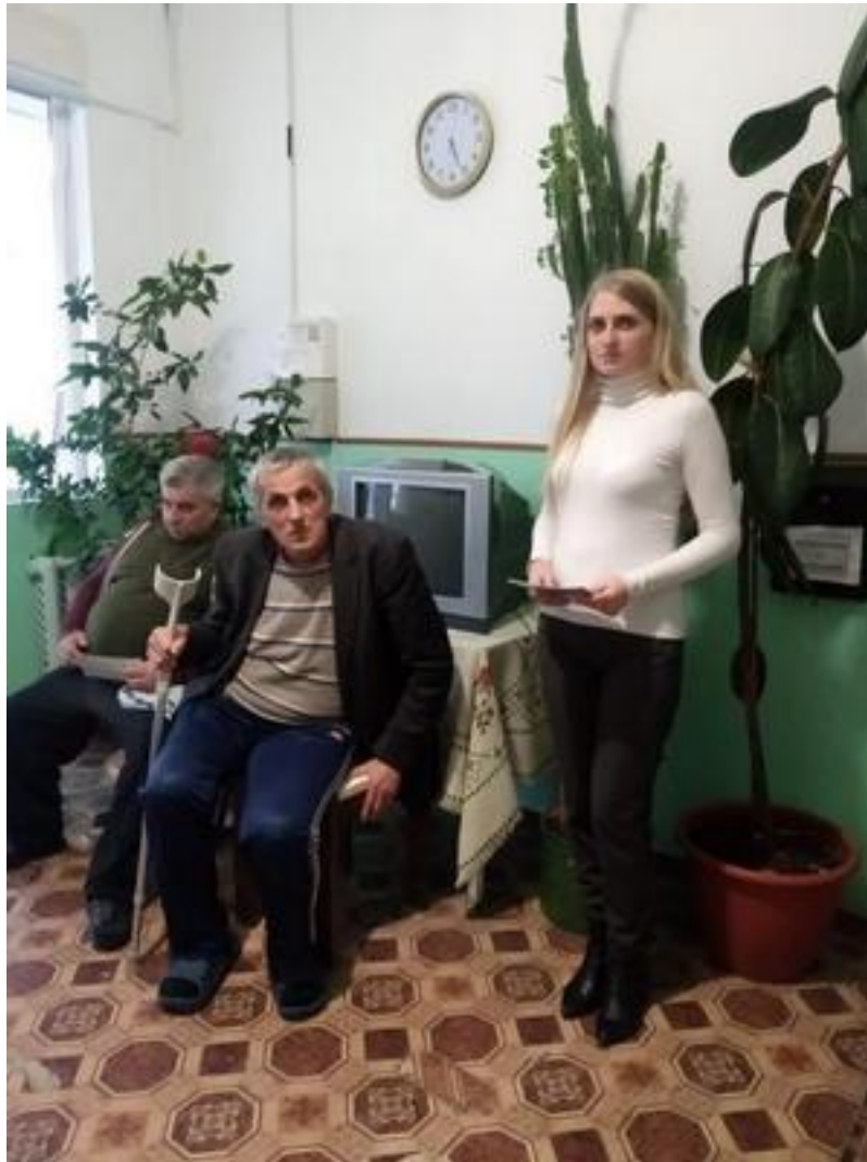
Фахівець Камінь-Каширського бюро правової допомоги під час консультування громадян у Центрі надання соціального догляду для постійного проживання 18 березня 2021 року

Проведення правопросвітницьких семінарів на базі ОМС для жителів громад, спрямованих на роз'яснення змісту ключових реформ (змін у законодавстві) у сфері соціального захисту, освіти, охорони здоров'я, пенсійного забезпечення, а також актуальних питань життя громад, зокрема: захисту прав споживачів комунальних послуг, організації ОСББ, безоплатного отримання земельних ділянок, громадської безпеки із залученням партнерів з числа громадських організацій, державних установ та комунальних установ органів державної влади та місцевого самоврядування, та інших відповідно до потреби