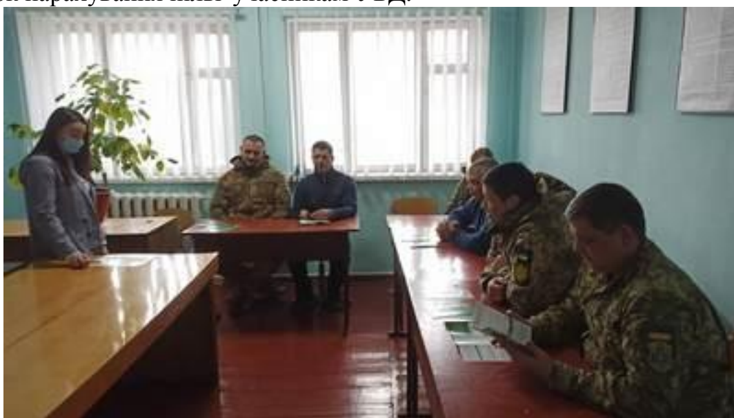
Начальник Турійського бюро правової допомоги під час зустрічі з колективом центру комплектування та соціальної підтримки 14 березня 2021 року

Серед присутніх учасників зустрічі розповсюдили буклети з інформацією про систему безоплатної правової допомоги в Україні та про порядок нарахування пільг учасникам УБД.