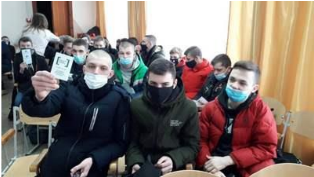
Фахівець Ковельського місцевого центру з надання БВПД під час заходу для студентів на тему: «Кібербулінг: попередження та відповідальність» 10 лютого 2021 року

Зауважили також, що за вчинення булінгу та кібербулінгу наступає адміністративна відповідальність, та розповіли про розміри штрафів. Насамкінець зустрічі підліткам наголосили, що за захистом своїх прав вони можуть звертатися до Ковельського місцевого центру з надання безоплатної вторинної правової допомоги, а також розповсюдили брошури «Булінг – це насильство», «Як протидіяти домашньому насильству», «Твої права твій надійний захист» та «Безоплатна правова допомога».