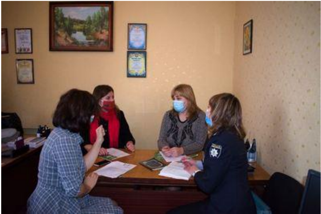
Участь представників Ковельського МЦ в робочій зустрічі з партнерами 20 січня 2021 року

Проведення тематичних інформаційних заходів, круглих столів, зустрічей, семінарів, лекцій (у тому числі на базі громадських організацій, міськрайонних, районних та міських центрів зайнятості) для безробітних, ВПО, учасників АТО з питань їх соціального захисту