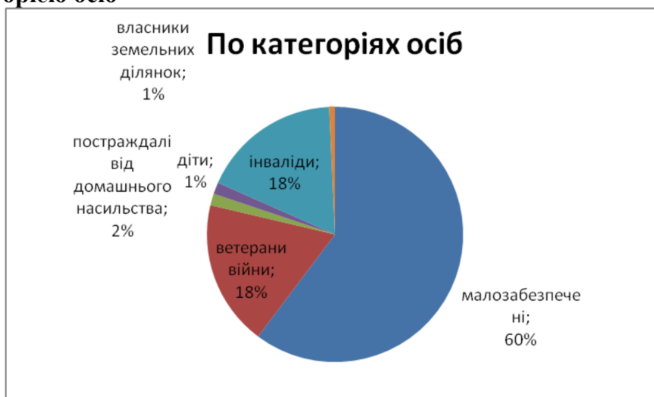
Діаграма 4 щодо розподілу клієнтів, яким надано БВПД, за категорією осіб

Крім цього, місцевим центром в тому числі бюро правової допомоги за I квартал було: