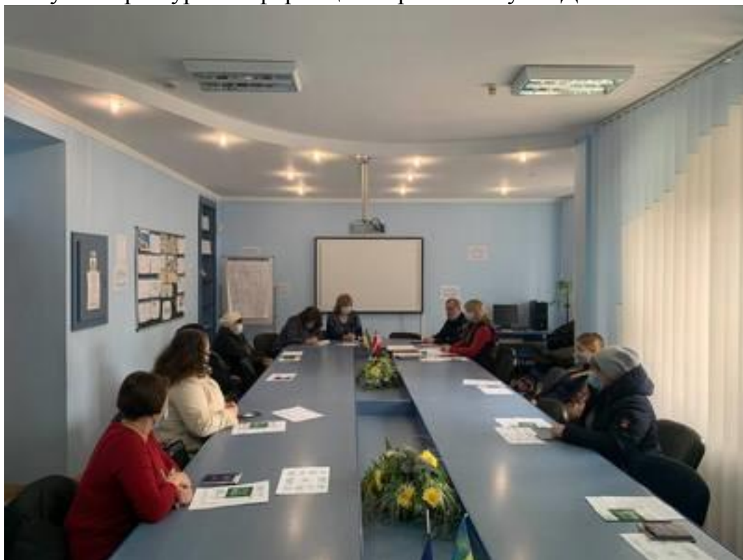
Участь в заході для безробітних фахівця Ковельського місцевого центру на базі Ковельського міськрайонного центру зайнятості 10 березня 2021 року

Усі учасники семінару отримали буклети «Протидія домашньому насильству» та брошури з інформацією про систему БПД.