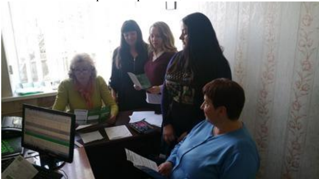
Начальник Турійського бюро правової допомоги в процесі виявленню авторитетних осіб для залучення їх в якості параюристів 18 лютого 2021 року

Представник правової допомоги розповіла про систему безоплатної правової допомоги в Україні, звернувши увагу на створенні та функціонуванні Турійського бюро правової допомоги. В ході спілкування надано роз'яснення стосовно надання безоплатної первинної та вторинної правової допомоги. Присутнім було роз'яснено хто має право на безоплатну правову допомогу, які правові послуги включає безоплатна правова первинна та вторинна допомога, хто є суб'єктом права на безоплатну вторинну правову допомогу, який порядок звернення за наданням безоплатної вторинної правової допомоги.