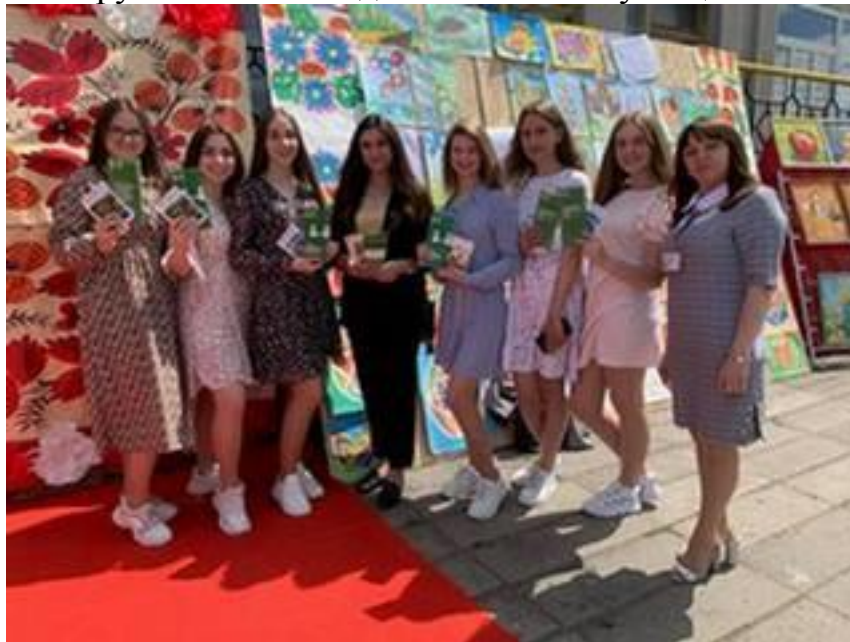
Начальник Ратнівського бюро правової допомоги під час заходів, проведених з метою ознайомлення дітей з їх правами 1 червня 2021 року

у сфері захисту прав дитини, була ратифікована Україною ще 27 лютого 1991 року і набула чинності 27 вересня 1991 року. Держава вживає всіх необхідних законодавчих, адміністративних, соціальних і просвітніх заходів з метою захисту дитини від усіх форм фізичного та психологічного насильства, образи чи зловживань, відсутності піклування чи недбалого і брутального поводження та експлуатації.