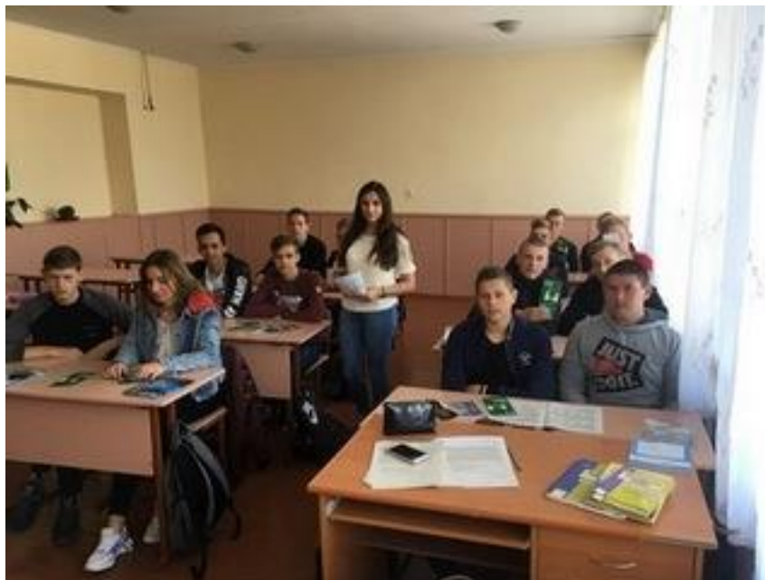
Начальник Ратнівського бюро правової допомоги було під час тематичного заходу учнів 11 класу НВК "ЗОШ I-III ступеня №1-гімназія ім. героя Радянського Союзу В.Газіна" смт Ратне 19 травня 2021 року

Під час проведення заходу вчителям та учням було розповсюджено буклети, інформаційні матеріали із циклу «Я МАЮ ПРАВО!» та брошури з інформацією про діяльність системи безоплатної правової допомоги в Україні.