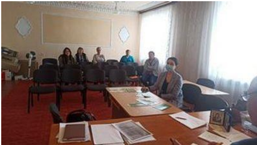
Начальник Турійського бюро правової допомоги під час виїзного консультування громадян у приміщенні Луківської селищної ради 11 травня 2021 року