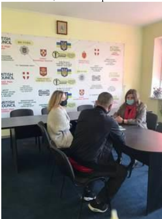
Зустріч з представниками пробації 20 квітня 2021 року

Того ж дня було здійснено консультування осіб, що перебувають на обліку в секторі пробації. Троє громадян отримали юридичні поради з питань трудового, сімейного та цивільного права.