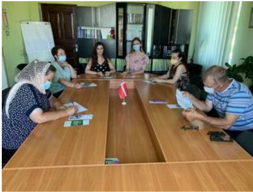
Начальником Ратнівського бюро правової допомоги під час семінару з безробітними в Ратнівській районній філії Волинського обласного центру зайнятості 17 червня 2021 року