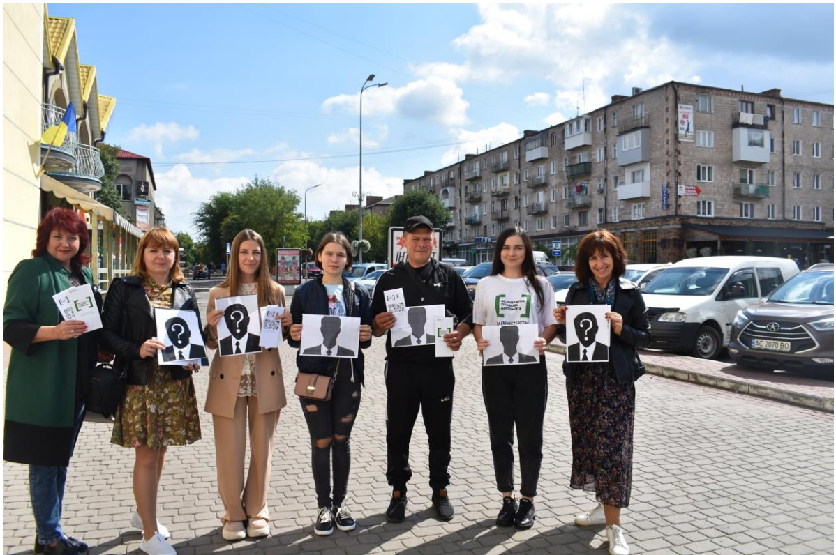
Фахівець Ковельського місцевого центру з надання безоплатної вторинної правової допомоги під час проведення вуличного інформування населення.