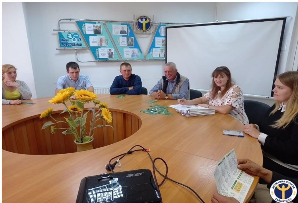
Начальник Камінь-Каширського бюро правової допомоги під час проведення семінару для безробітних Любешівської районної філії Волинського обласного центру зайнятості