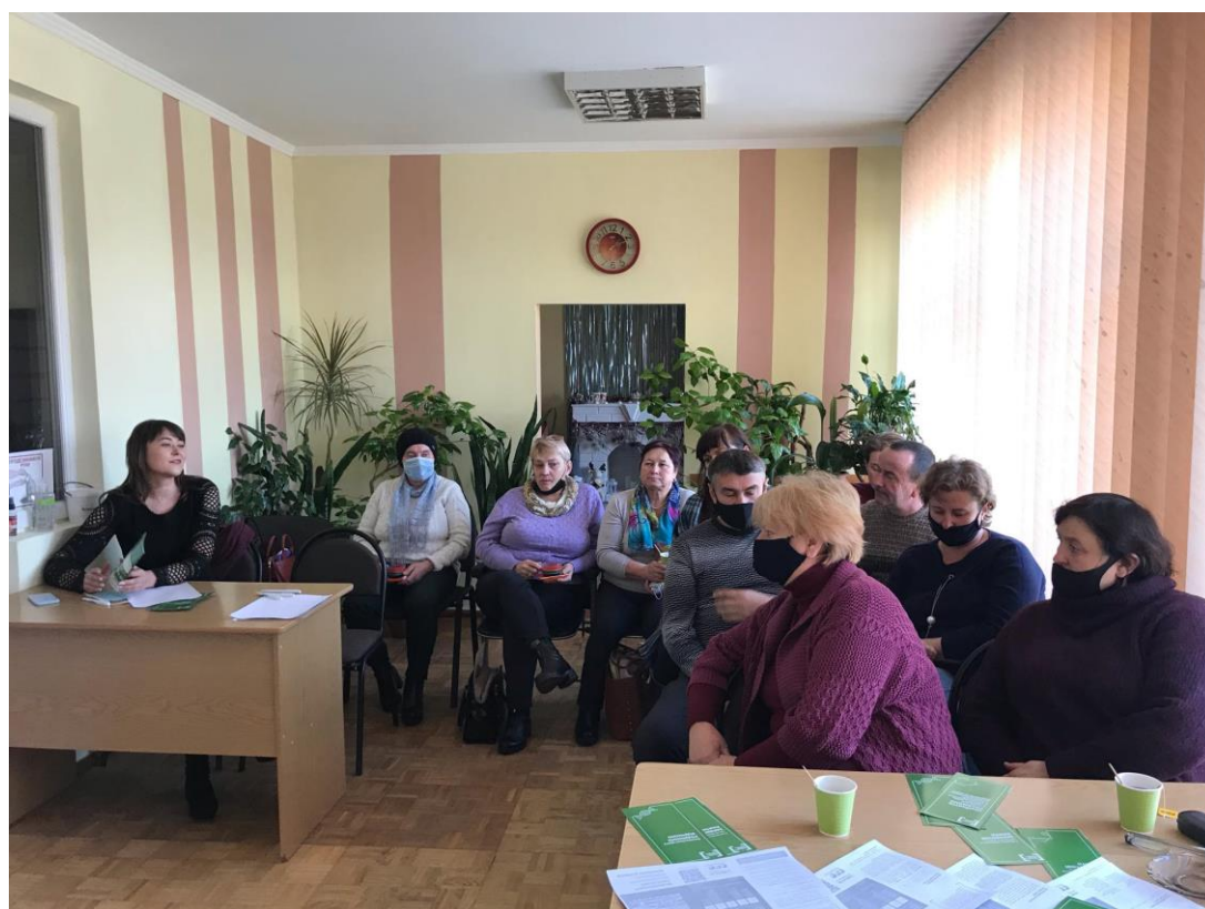
Фахівець центру консультує жителів с.Дубове з питань, пов'язаних із земельним законодавством