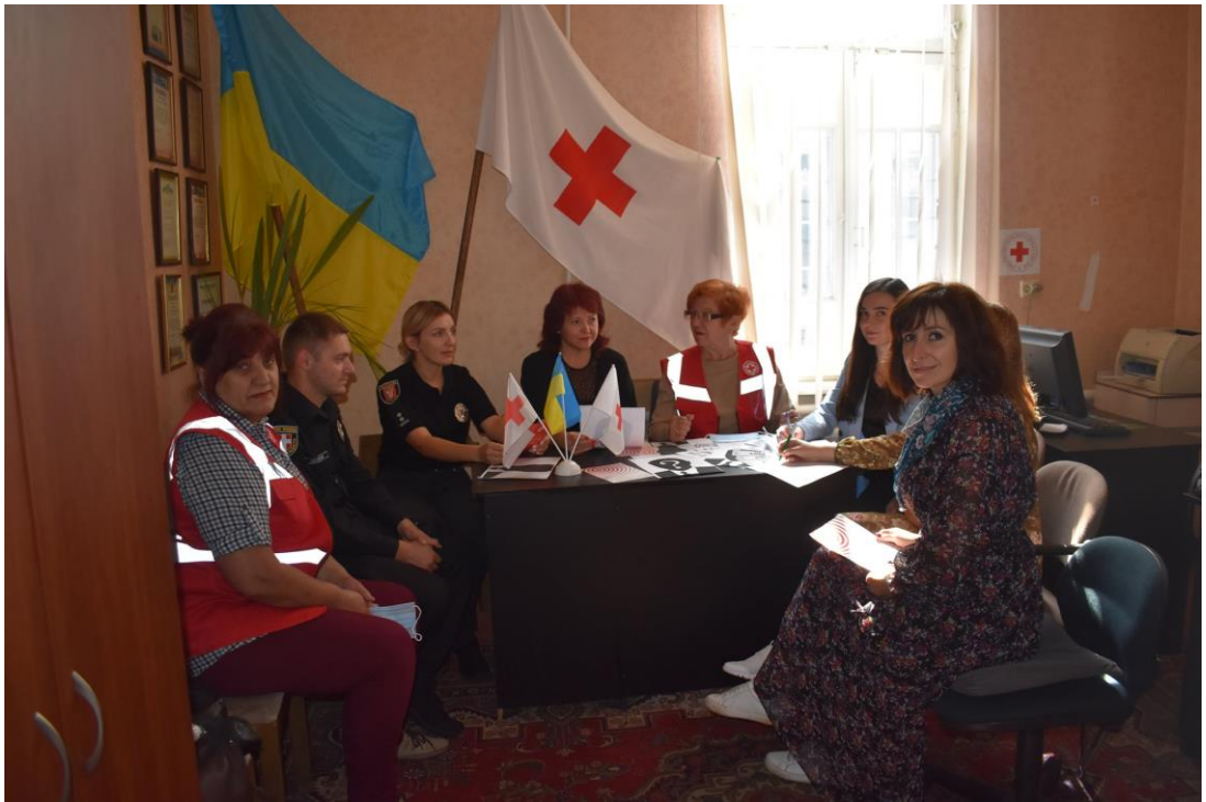
Участь представників Ковельського МЦ в робочій зустрічі з партнерами 28 серпня 2021 року