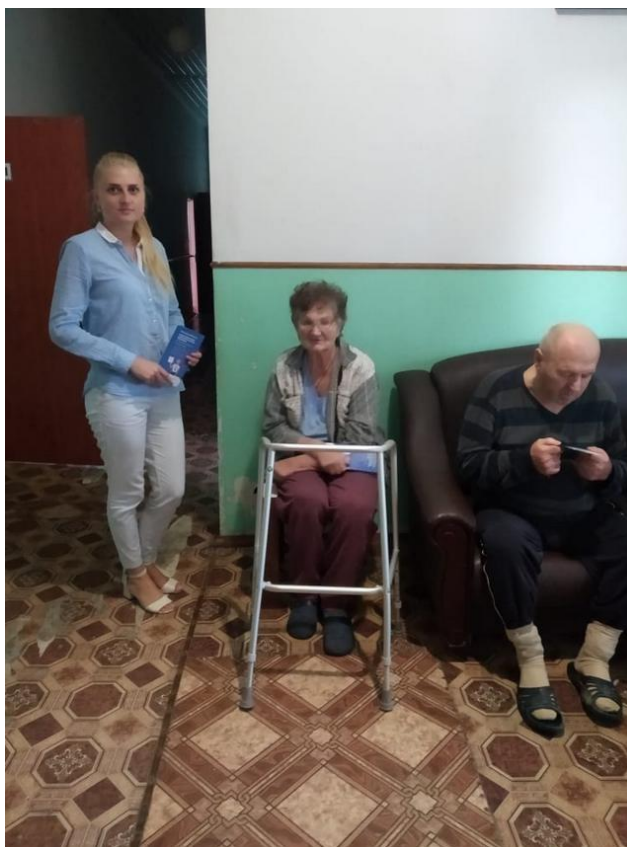
Фахівець Камінь-Каширського бюро правової допомоги під час консультивання громадян у Центрі надання соціального догляду для постійного проживання

Під час прийому фахівець бюро розповіла, хто має право на безоплатну правову допомогу, які правові послуги включає безоплатна первинна та вторинна правова допомога, хто є суб'єктом права на безоплатну вторинну правову допомогу, який порядок звернення за її наданням.