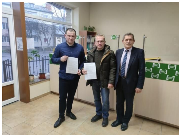
Меморандум із ГО «Холмщина»

Підготовлено проекти аналогічних Програм для населення Головнієнської та Зимнівської територіальних громад, які винесені на розгляд чергових сесій місцевих рад.