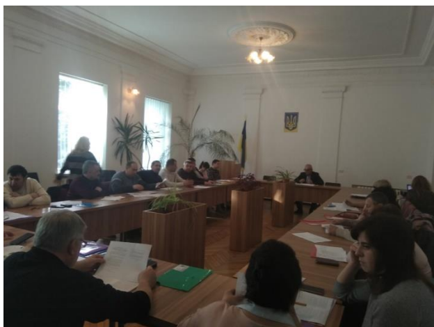
Сесія Устилузької міської ради

роки, розроблену місцевим центром з надання БВПД.