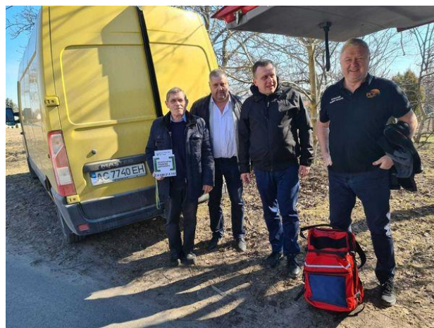
Фахівці центру в якості волонтерів

Приємно усвідомлювати, що наше суспільство ще зберігає в собі потенціал до добрих справ, спрямованим на творення.