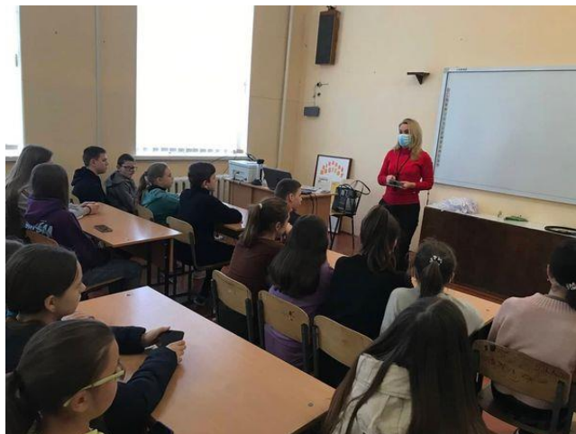
Захід у ліцеї імені Юрія Лелюкова

Вирішальна роль у протидії насильству у дитячому середовищі належить педагогам. Проте впоратися з цією проблемою вони можуть тільки завдяки системному підходу та підтримки не тільки керівництва школи, батьків, представників місцевих органів влади та громадських організацій. а також із залученням та участі фахівців системи безоплатної правової допомоги.