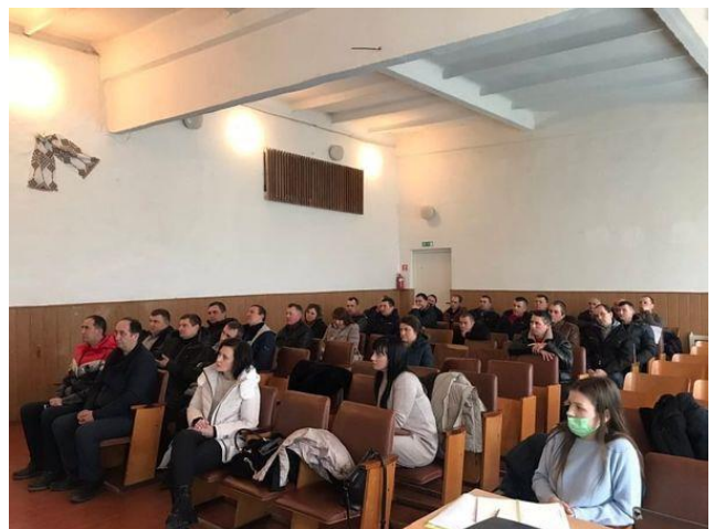
Семінар-навчання у Павлівській територіальній громаді

Фахівці системи безоплатної правової допомоги також ознайомили учасників семінару з реалізацією проєкту «Програма «Прискорення приватних інвестицій у сільське господарство України», істотними умовами договору оренди землі, законодавчим регулюванням продажу земель сільськогосподарського призначення.