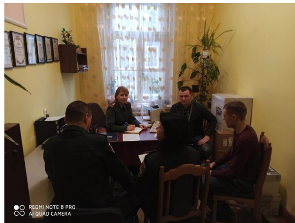
У Нововолинській та Володимирській філіях пробації

Створювалися належні умови для забезпечення реалізації суб`єктами пробації та особами, які відбули покарання у виді обмеження волі або позбавлення волі на певний строк, а також іншими особами, які потребують соціальної адаптації, права на безоплатну правову допомогу.