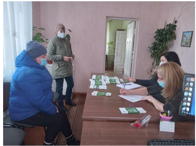
Консультування у Мишівському та Соснинському старостинських округах

18, 22, 23 лютого аналогічні заходи були проведені у Війницькому, Холопицькому, Затурцівському старостинських округах Володимир-Волинського району.