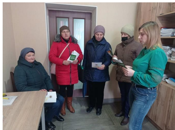
Консультування у селах Локачинщини

Під час проведення виїзних консультувань та правопросвітницьких