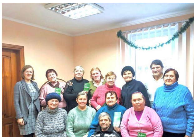
Заходи у Володимир-Волинському та Шацькому Територіальних центрах

Також до заняття були запрошені працівники Шацького будинку культури, які провели тематичний захід з нагоди Дня соборності України «Україна вільна, соборна, єдина», які акцентували увагу на головну традицію відзначення – «живий ланцюг», який є символом духовної єдності людей східних та західних земель, а потім пролунали пісні у виконанні учасників ансамблю «Молодички».