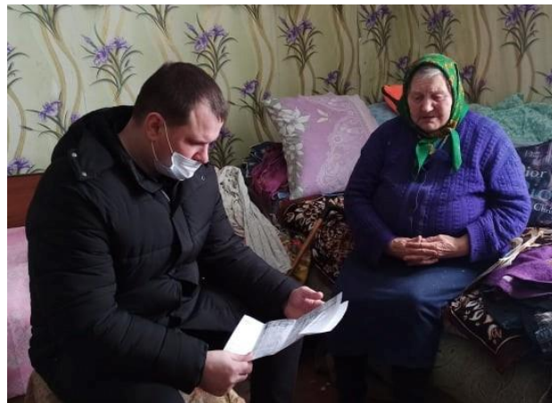
Надання адресної правової допомоги

4 лютого укладено меморандум про співпрацю та взаємодію між Володимир-Волинським місцевим центром з надання безоплатної вторинної правової допомоги та Устилузькою міською радою.