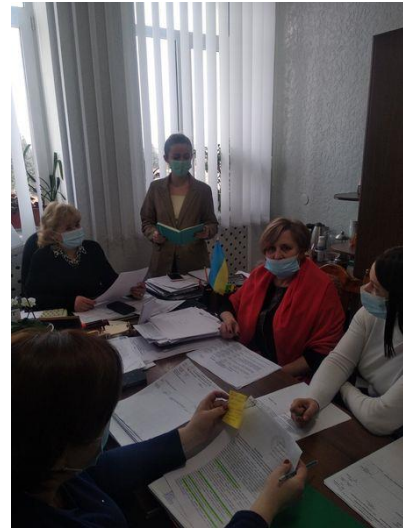
Круглий стіл у Шацькій селищній раді

Центром здійснювалось проведення правопросвітницьких заходів та виїзного консультування з основних проблемних питань для потенційних суб`єктів права на безоплатну вторинну правову допомогу в місцях їх перебування, з метою навчання людей вміти захищати свої права, зокрема для дітей загальноосвітніх, професійно-технічних, вищих навчальних закладів.