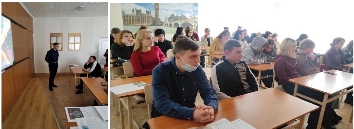
Засідання кіноклубу Docudays UA

Під час заходу юрист Нововолинського бюро правової допомоги розповів присутнім про систему безоплатної правової допомоги в Україні, як нею скористатись, хто має право на безоплатну вторинну правову допомогу.