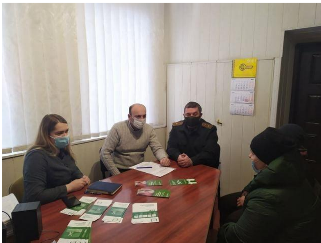
Фахівець Камінь-Каширського бюро правової допомоги під час проведення консультування підоблікових Камінь-Каширського районного сектору «Центр пробації» у Волинській області