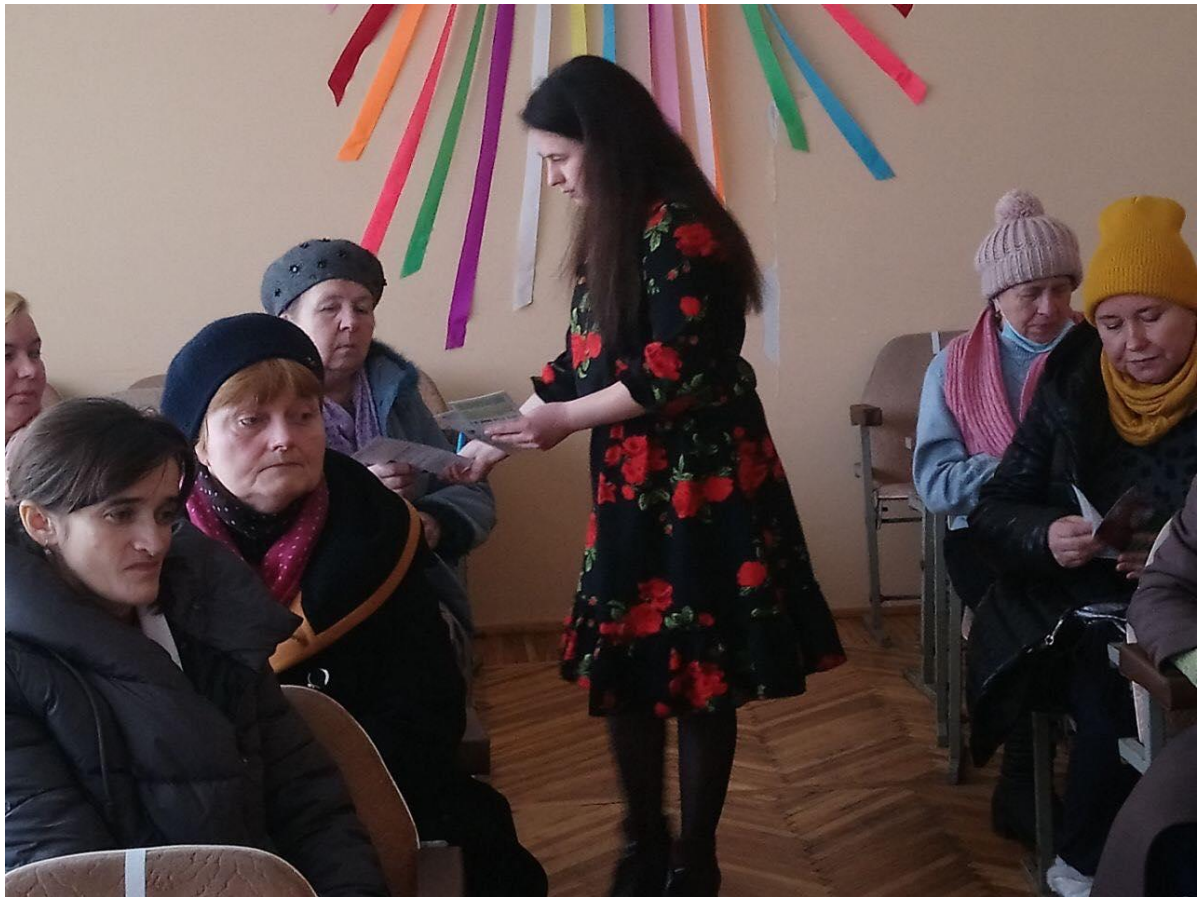
Головний юрист Ратнівського бюро правової допомоги під час проведення заходу для прийомних батьків, опікунів/ піклувальників, які проживають на території Ратнівської територіальної громади