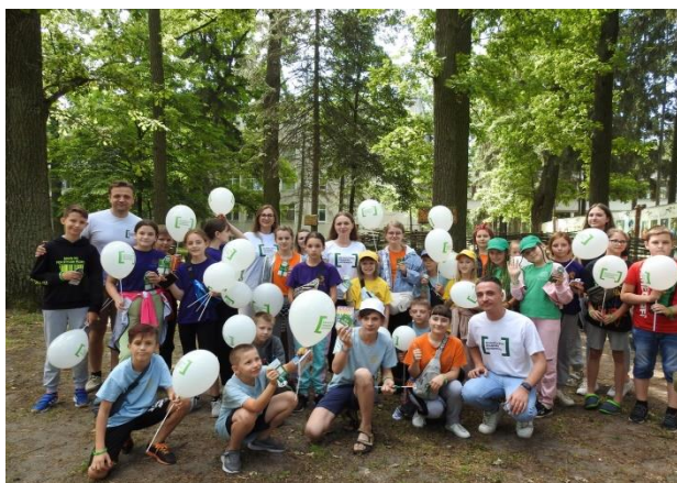
Пилипа Орлика» для юних артеківців.

Загальнонаціональний карантин та пов'язані з ним обмежувальні заходи внесли свої корективи в роботу системи БПД. Тому правопросвітницькі заходи під час карантину проводились онлайн за допомогою комунікаційної платформи ZOOM та в режимі прямих ефірів на сторінках Facebook.