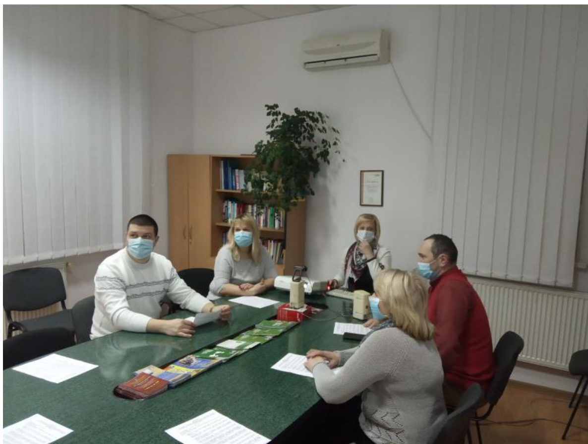
Засідання діалогового майданчика з профорієнтації. Заліщицька районна філія Тернопільського облого центру зайнятості.

Хто має реалізувати право дітей на освіту: держава чи батьки? Чи впливає якість освіти на життя громади? На ці та інші питання шукали відповідь учні 5-9 класів Угринської ЗОШ І-ІІ ст. під час правової гри, яку провели фахівчині бюро правової допомоги Чортківського місцевого центру 16 лютого.