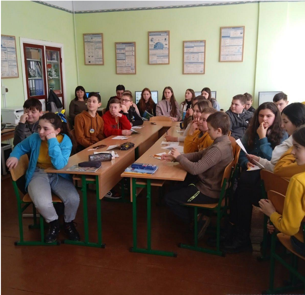
Правова гра для учнів Угринська ЗОШ І-ІІ ст.

16 лютого працівники сектору «Чортківське бюро правої допомоги» провели роботу консультативного пункту доступу громадян до безоплатної правової допомоги із земельних питань в Угринському старостинському окрузі.