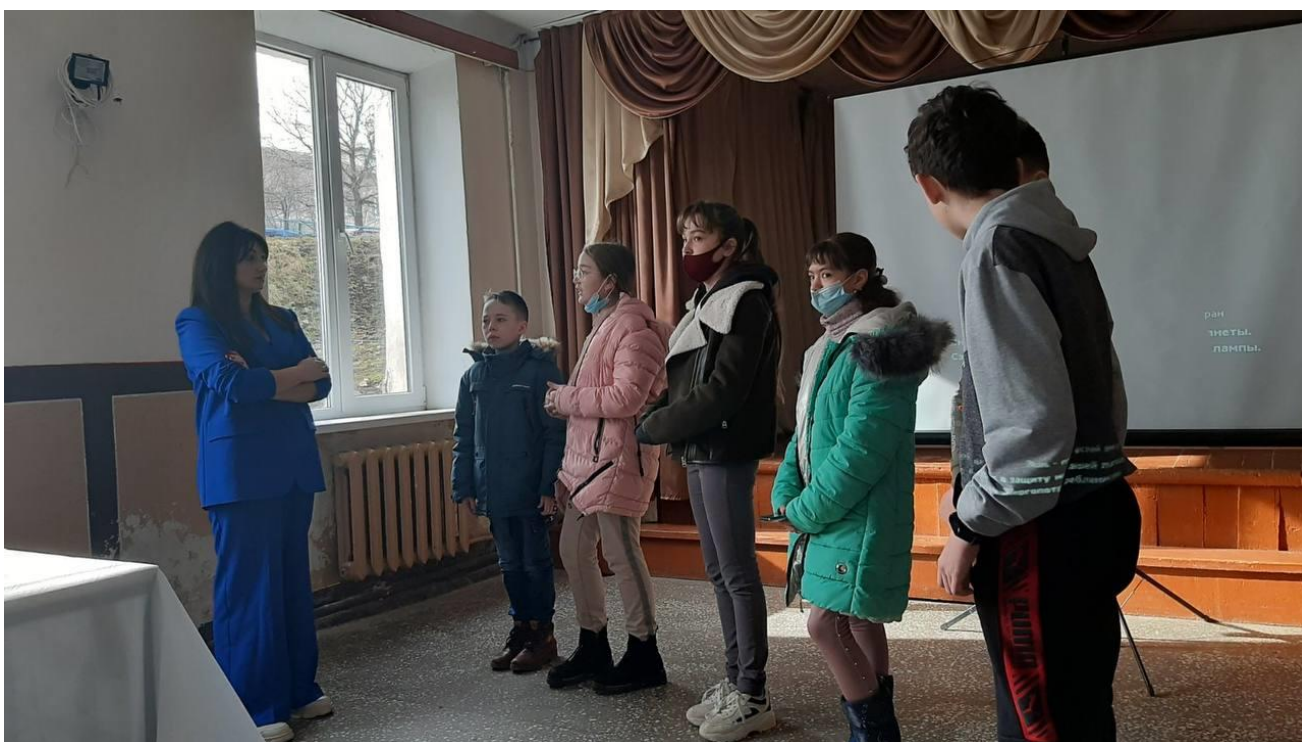
Урок правових знань щодо протидії булінгу. Товстенська ЗОШ І-ІІІ ст.