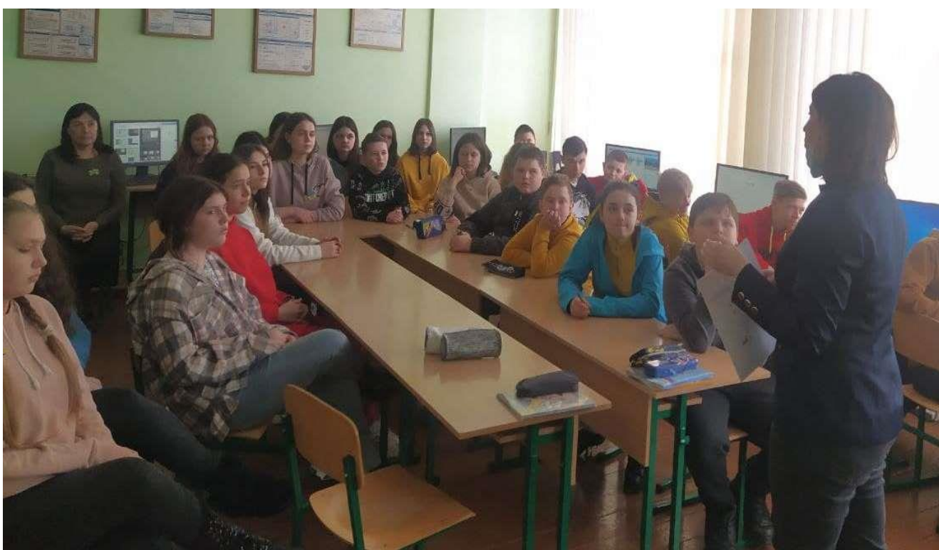
Правова гра для учнів Угринська ЗОШ І-ІІ ст.

Після участі у заході діти зробили висновок, що права людини є взаємопов'язаними, неподільними та взаємозалежними. Кожна людина має знати про свої права та поважати права інших.