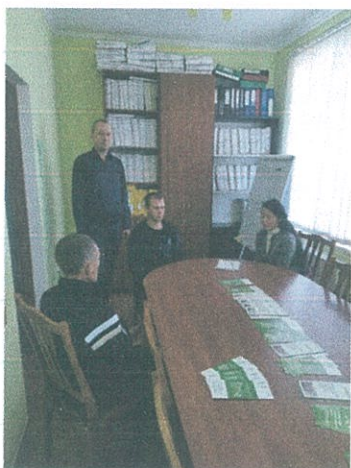
Правопросвітницький захід у Луцькому районному відділі філії Центру пробації в Волинській області