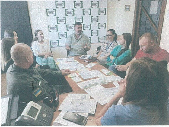
Робоча зустріч по обміну досвідом.