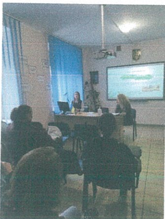
Правопросвітницький захід у Луцькому міському центрі зайнятості