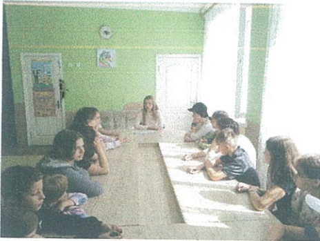
Притулок для дітей Волинської ОВА

тему «Захист від домашнього насильства». Дітям, які перебувають у Притулку повідомлено про види домашнього насильства, способи протидії та захисту від нього. Надано практичні поради дій у разі, якщо особа стала жертвою домашнього насильства. На завершення, серед присутніх розповсюджено буклети БПД з контактними даними бюро.