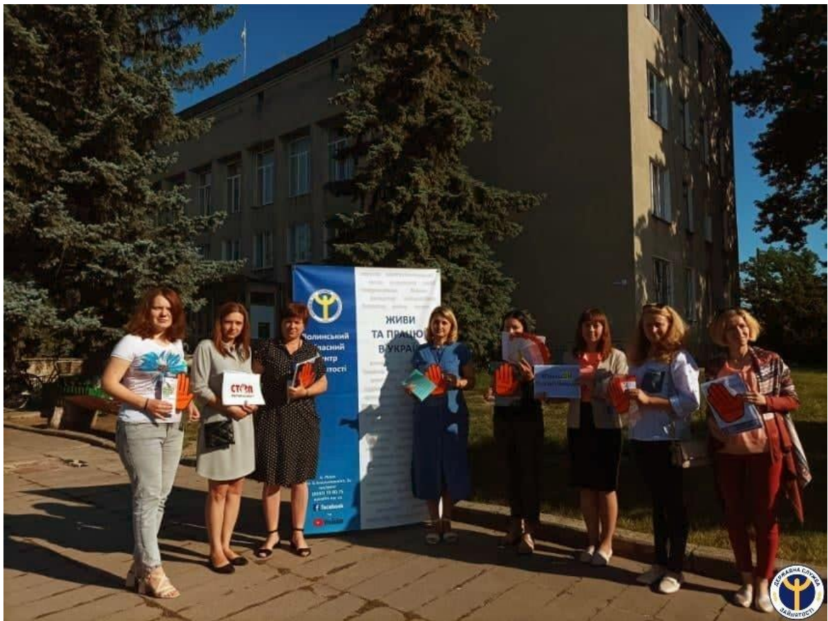
Фахівці Ковельського місцевого центру під час проведення вуличного інформування населення з нагоди Всесвітнього дня протидії торгівлі людьми

День Незалежності України – це свято із сакральним змістом. Це не лише про державну незалежність, а й про свободу на всіх рівнях. Права, свободи та обов’язки є головним елементом правового статусу людини і громадянина. Система БПД є стоїть на сторожі захисту прав і свобод громадян.