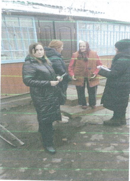
Виїзд до Суського старостинського округу

роботи КУ "Центр надання соціальних послуг Ківерцівської міської ради відвідали осіб з інвалідністю Суського старостинського округу. Мета виїзду розповісти громадянам про права та свободи, гарантовані особам з інвалідністю законодавством України та міжнародно-правовими актами.