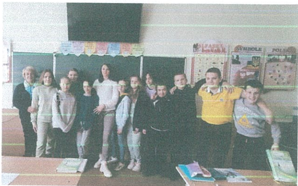
Правопросвітницький захід у Рокинівському ліцеї №38

тему "Профілактика булінгу серед підлітків". Під час заходу учні дізналися про поняття булінгу його види та як вберегти себе від цькування однолітків.