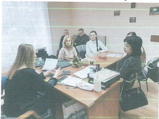
Круглий стіл з адвокатами які надають БВПД

30 грудня 2022 року директор Луцького місцевого центру провела круглий стіл з адвокатами, які надають безоплатну вторинну правову допомогу. Під час зустрічі обговорили проблемні питання які виникали під час роботи у 2022 році та шляхи їх вирішення.