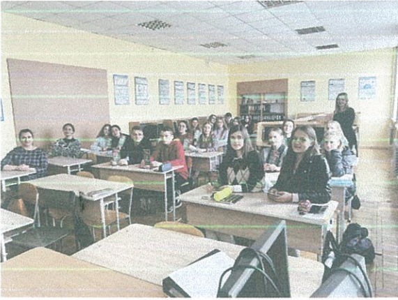
Правопросвітницький захід ФКТБП ВНУ імені Лесі Українки