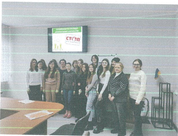
Правопросвітницький захід у Фаховий технічний коледж ЛНТУ

25 листопада 2022 року в рамках акції "16 днів проти насильства" помічник юриста Луцького місцевого центру провела бесіду для студентів Технічного фахового коледжу ЛНТУ на тему "Запобігання та протидія домашньому насильству". Під час бесіди обговорили що таке насильство, його види та ознаки, як потрібно діяти, коли постраждав/ла від домашнього насильства, а також до кого потрібно звернутися за допомогою.