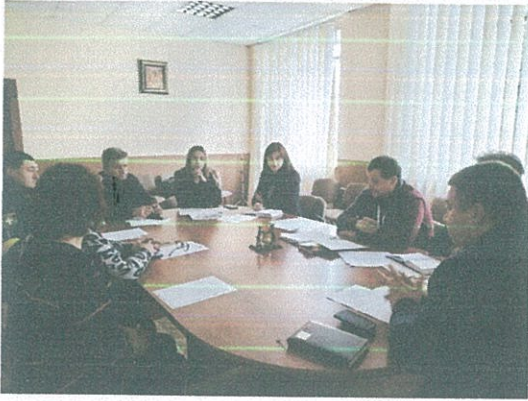
Круглий стіл в рамках Всеукраїнської акції «16 днів проти насильства»

наси́льства» під час якого обговорювалося питання взаємодії суб'єктів щодо протидії домашньому насильству. Під час якого обговорено про алгоритм дій у разі виявлення ознак чи фактів, що можуть вказувати на вчинення домашнього насильства.