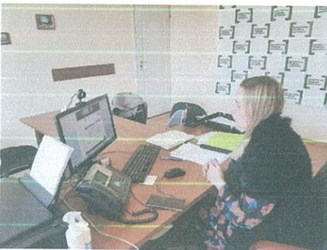
Онлайн навчання фізичних осіб, які виявили бажання надавати соціальні послуги з догляду без здійснення підприємницької діяльності.

9 листопада 2022 року у режимі онлайн директор Луцького місцевого центру провела базове навчання фізичних осіб, які виявили бажання надавати соціальні послуги з догляду без здійснення підприємницької діяльності, яке організоване Волинським обласним центром соціальних служб. Метою навчання, є сприяння засвоєнню базових знань, необхідних для забезпечення надання соціальних послуг в умовах, пристосованих до потреб окремих категорій осіб.