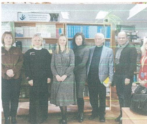
Учасники круглого столу «Дотримання прав людини в період воєнного стану»

11 грудня 2022 року у тренінговому центрі Волинська державна обласна універсальна наукова бібліотека ім. Олени Пчілки за ініціатив і Представництво Уповноваженого ВРУ з прав людини у Волинській області відбувся круглий стіл «Дотримання прав людини в період воєнного стану». До заходу долучилася директор Луцького місцевого центру та завідувач сектору Луцьке бюро правової допомоги. Учасники круглого столу обговорили актуальні питання прав людини в період воєнного стану та ознайомилися з тематичною виставкою, що була підготовлена працівниками відділу читальних залів.