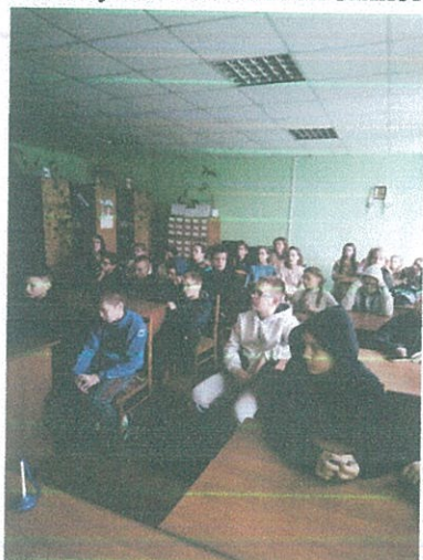
Правопросвітницький захід у КЗЗСО «Рожищенський ліцей № 1»

09 грудня 2022 року завідувач сектору Рожищенське бюро правової допомоги спільно з Центром соціальних служб та Рожищенською районною філією Волинського обласного центру зайнятості у КЗЗСО «Рожищенський ліцей № 1» для учнів в рамках Всеукраїнської акції «16 днів проти насильства» проведено правопросвітницький захід на тему «Запобігання та протидія булінгу». Під час заходу учням роз’яснено про види булінг та способи захисту і протидії.