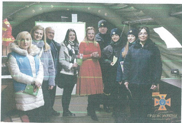
Тематична зустріч з рамках проведення Всеукраїнської акції