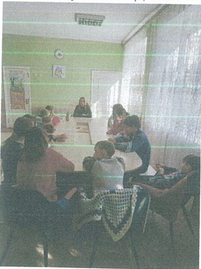
Правопросвітницький захід у притулку для дітей Волинської ОДА

17 жовтня 2022 року в приміщенні Притулку для дітей Волинської ОДА проведено правопросвітницький захід на тему «Запобігання та протидія булінгу та домашнього насильства». Під час заходу дітям роз'яснено про поняття булінгу та домашнього насильства, його види, як захиститись від проявів булінгу та домашнього насильства. За допомогою практичних завдань діти навчилися відрізняти булінг від сварки, як звернутись за допомогою і які дії вчиняти, якщо стали свідком булінгу. Також, роз'яснено щодо алгоритму дій у разі, якщо особа стала жертвою чи свідком домашнього насильства. Діти активно брали участь в обговоренні теми та отримали буклети БПД з контактними даними бюро.