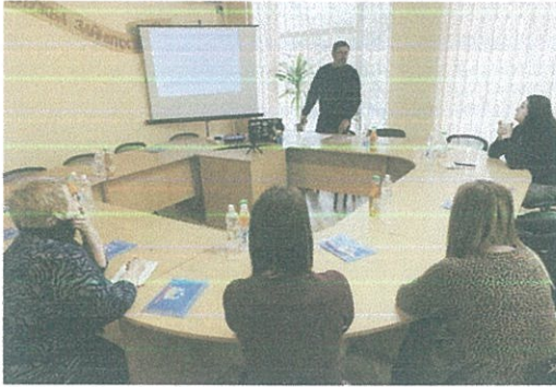
Тренінг «Правова допомога людям з постраждалих громад – ВПО: ключові виклики та шляхи вирішення»

23 грудня 2022 року фахівці Луцького місцевого центру взяли участь у тренінгу «Правова допомога людям з постраждалих громад – ВПО: ключові виклики та шляхи вирішення», що був організований ГО «Волинські перспективи».