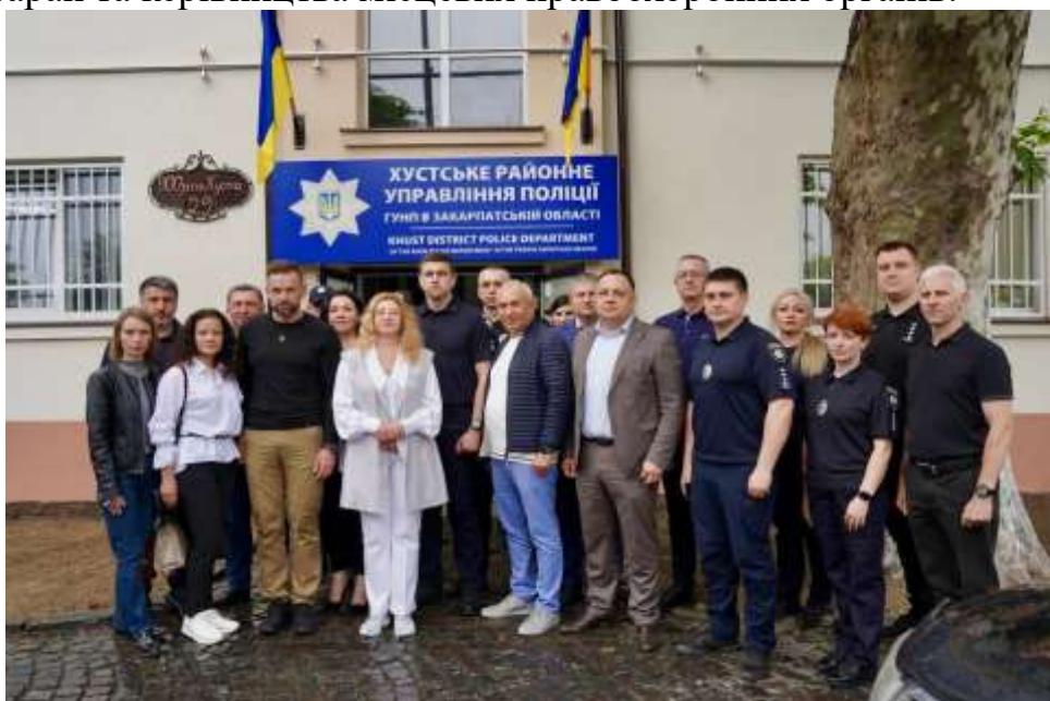
[1.3] Забезпечення вирішення проблем у правовий спосіб за допомогою