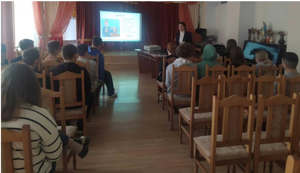
Тренінг з прав людини для учнів 9-х класів Чортківської школи-інтернат спортивного спрямування ім. Романа Ільяшенка посилання на захід

Важливо вміти розпізнавати ситуації, коли відбувається порушення прав людини, навчитися уникати таких порушень та підтримувати тих, хто зазнав утисків. Учасники активно виконували правові вправи, висловлювали свої думки та вели дискусії.