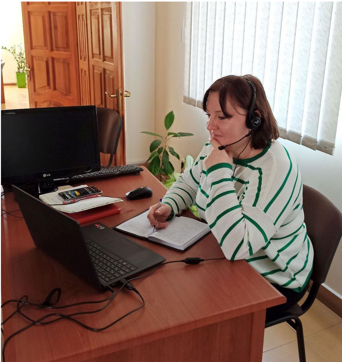
Робота кол-центру системи БПД посилання на захід

Також юристка долучилася як тренер у навчаннях для працівників системи безоплатної правової допомоги, які будуть надавати правову допомогу по телефону у 2023 році.