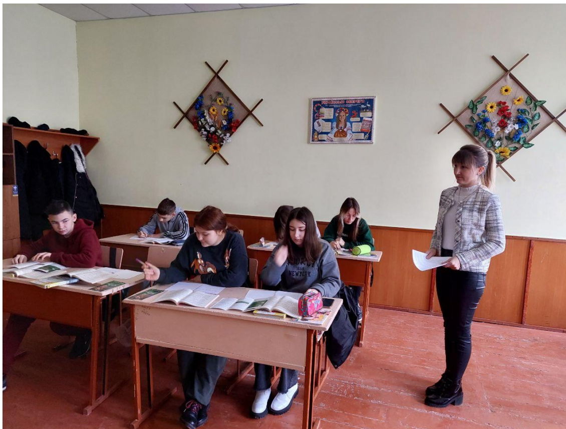
Тренінг на тему: "Захист прав та інтересів дітей в умовах воєнного стану" в Підзамочківській гімназії Бучацької міської ради.