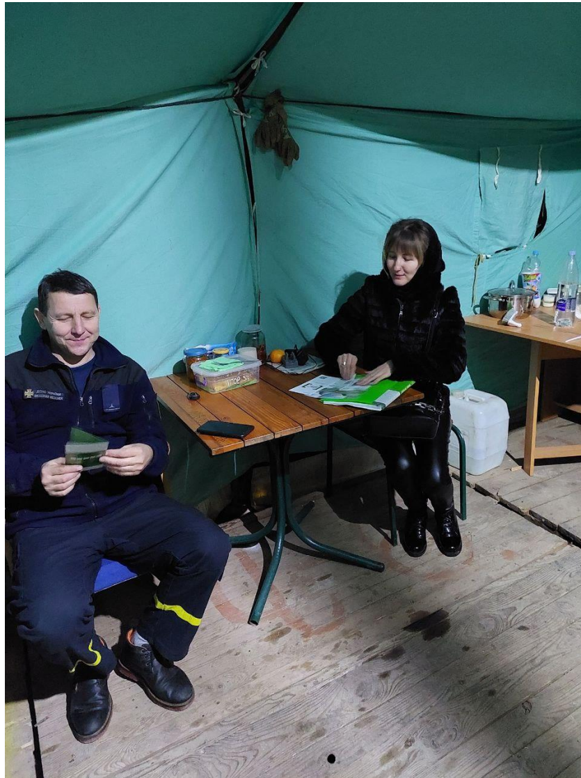
«Пункт незламності» ДСНС м. Бучач. Робота консультаційного пункту. посилання на захід

Триває співпраця з ГО «Гельсінська ініціатива XXI», а саме участь Чортківського МЦ у організації проведення Мандрівного кінофестивалю про права людини Docudays UA на Тернопіллі. З 20 по 22 грудня відбувся триденний кінопоказ в приміщенні місцевого центру. Також фахівці центру долучаються до заходів громадської організації в онлайн режимі та офлайн в Публічній бібліотеці Чортківської міської ради.