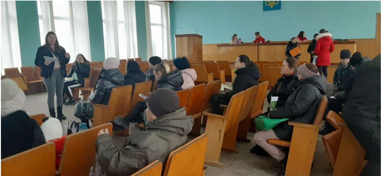
Зустріч з внутрішньо переміщеними особами в Монастириській міській раді Посилання на захід

Щорічно в Україні з 25 листопада по 10 грудня проводиться Всеукраїнська акція «16 днів проти насильства». Підтримуючи ініціативу цієї акції, та напередодні Дня безоплатної правової допомоги в Гусятинській публічній бібліотеці відбувся тренінг на тему: «Країною закону, права і мораль». Участь у заході взяли працівники сектору «Гусятинське бюро правової допомоги», відділу культури і туризму, центру надання соціальних послуг, центру культури і дозвілля, відділу освіти, сім'ї, молоді та спорту.