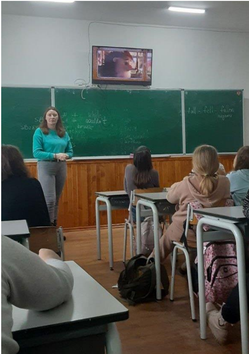
Урок права в Монастириській ЗОШ І-ІІІ ст. Посилання на захід

В грудні запрацювали консультаційні пункти доступу громадян до безоплатної правової допомоги в «Пунктах незламності» Чортківського району.