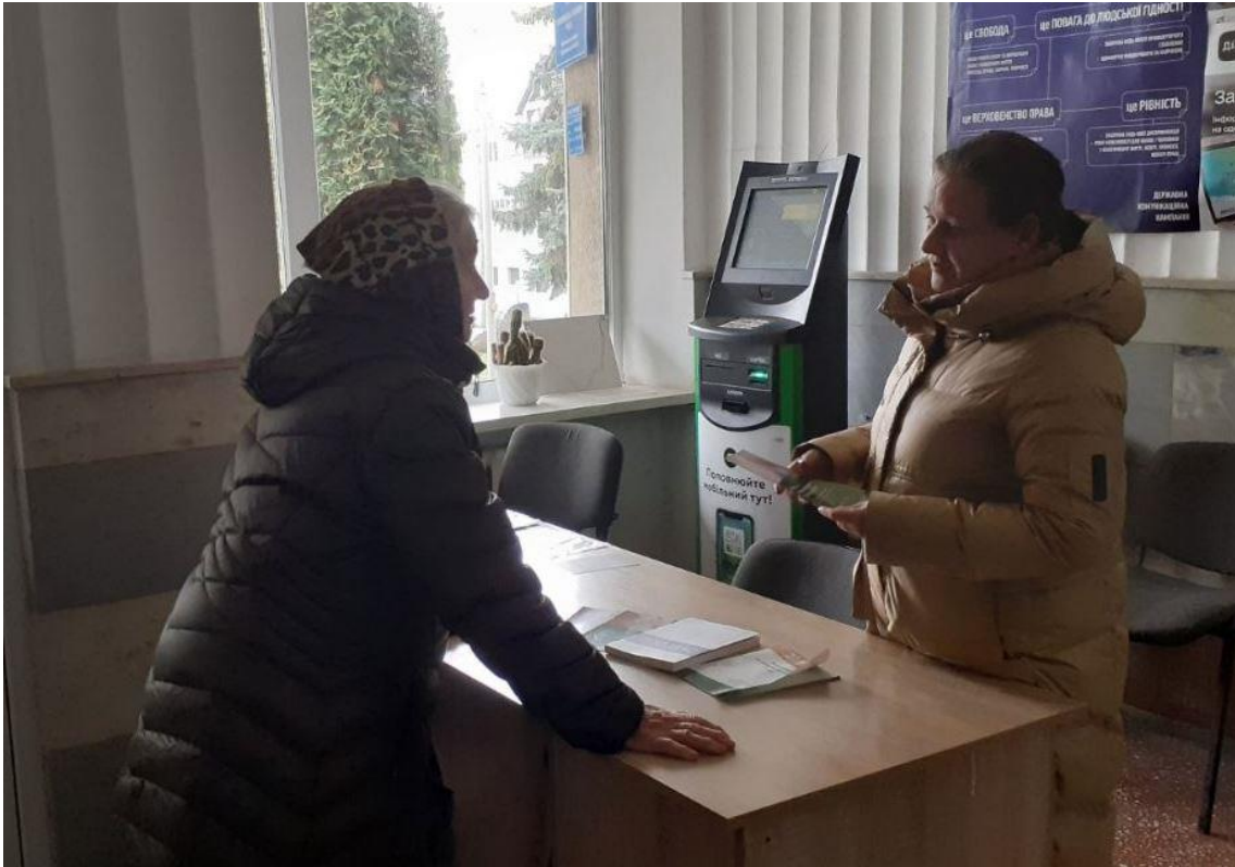
Робота консультаційного пункту в Гусятинській селищній раді