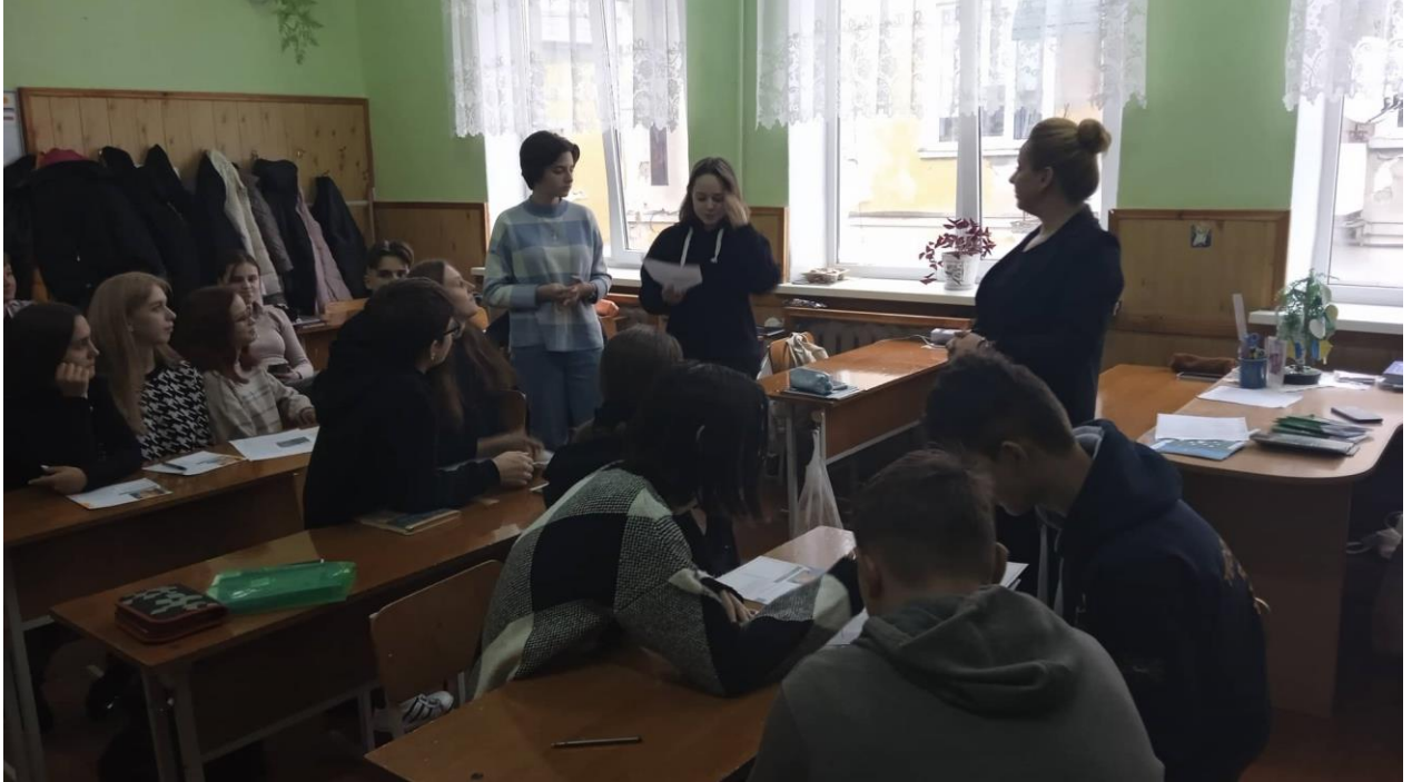
Тренінг з прав людини в Чортківській ЗОШ І-ІІІ ст №2 посилання на захід

Після тренінгу діти отримали друковані буклети з контактними даними бюро правової допомоги.