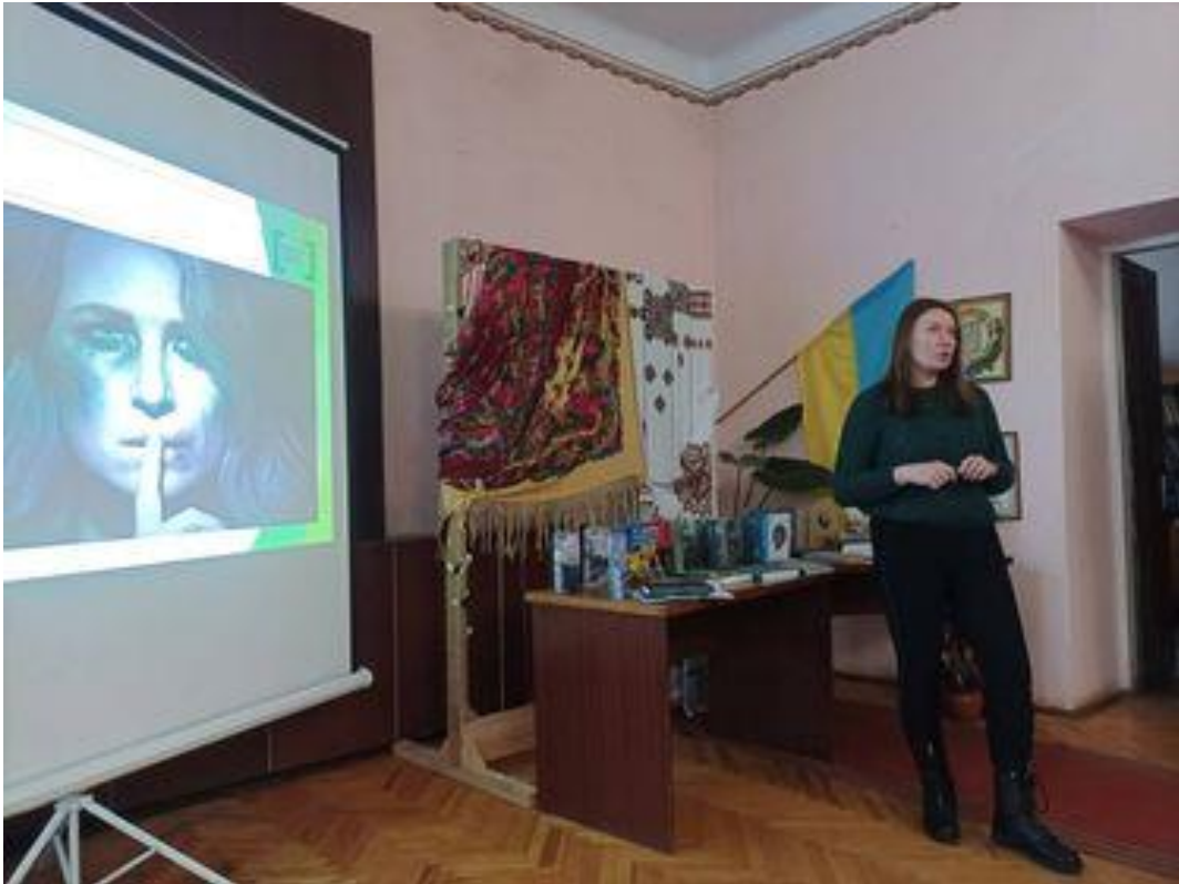
Семінар «Право на захист жінок, які потерпають від домашнього насильства» Посилання на захід

Серед присутніх розповсюджено інформаційні буклети системи безоплатної правової допомоги.